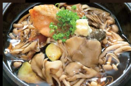
秋鮭と茄子の キノコあんかけ