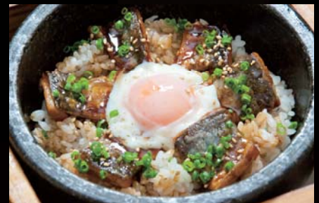
温玉のせ さんま石焼き飯