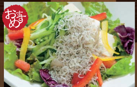
じゃこと豆腐の和風サラダ