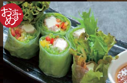
生ハムとクリームチーズの 生春巻き