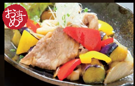
牛カルビーと彩野菜の 生姜風味炒め