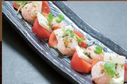
海老・トマト・モッツアレラ チーズのバジルソース