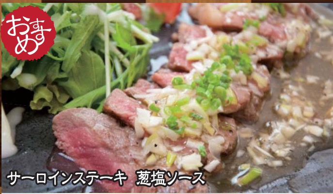
サーロインステーキ 葱塩ソース