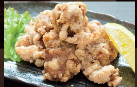
ラム肉の竜田揚げ