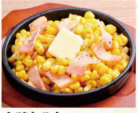
十勝とうきびバター醤油 404円 (税込437円)