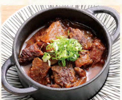
牛すじのどて焼き 602円 (税込651円)