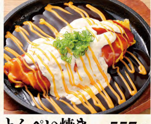
とんべい焼き チーズタルタル 557円 (税込602円)