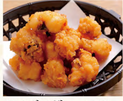
タコザンギ 521円 (税込563円)