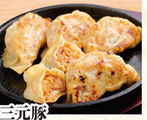
三元豚ジャンボ餃子 キムチ 647円 (税込699円)