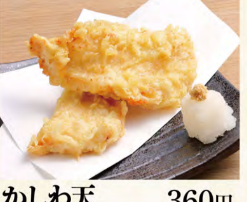
かしわ天 360円 (税込389円)