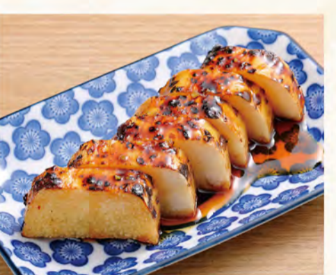
長芋炙り 503円 柚子胡椒タレ (税込544円)