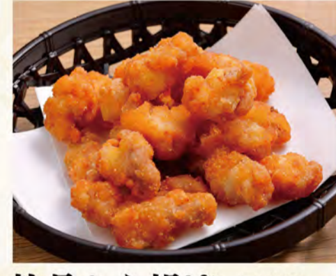
軟骨から揚げ 548円 (税込592円)