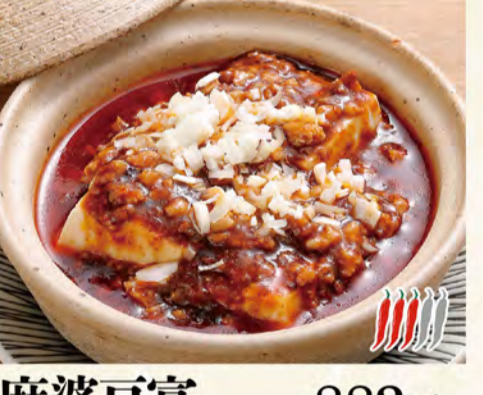
麻婆豆腐 882円 (税込933円)