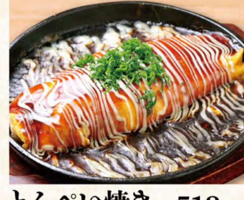
とんべい焼き レギュラー 513円 (税込555円)