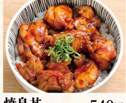
焼鳥丼 540円 (税込584円)