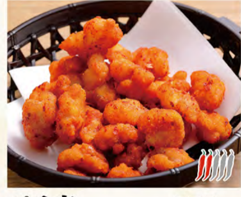
ピリ辛軟骨唐揚げ 575円 (税込621円)