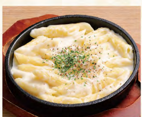
ゴルゴンゾーラペンネ 482円 (税込521円)