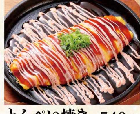
とんべい焼き 明太マヨ 540円 (税込584円)