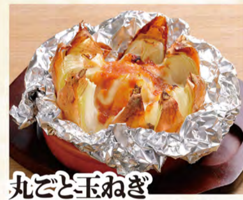
丸ごと玉ねぎ炙り焼き 449円 ニンニク味噌 (税込485円)