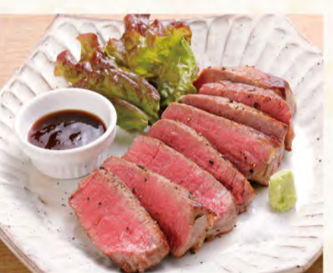
牛フィレステーキ 1,620円 (税込1,750円)