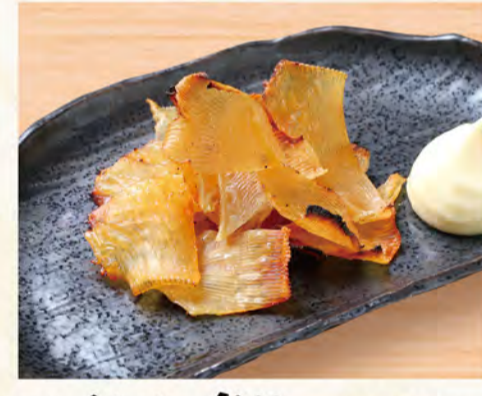
エイヒレ炙り 575円 (税込621円)