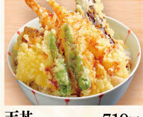
天井 719円 (税込777円)