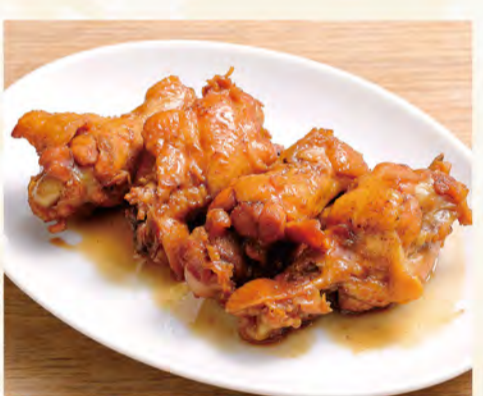
手羽元煮込み 522円 (税込564円)