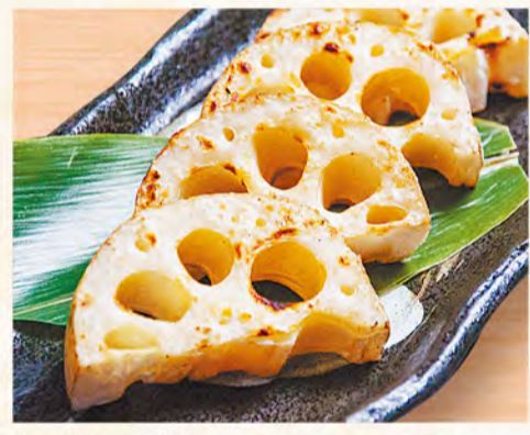
レンコン炙り焼き 575円 (税込621円)