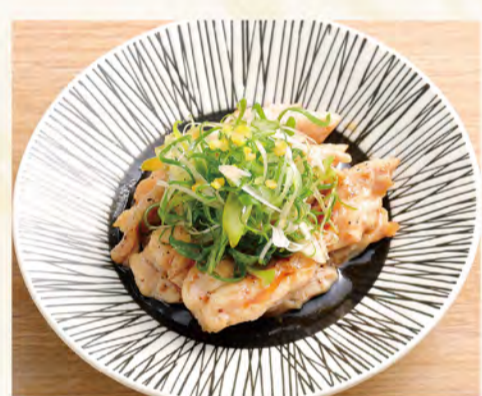
せせりと九条葱のゆずポン酢 584円 (税込631円)