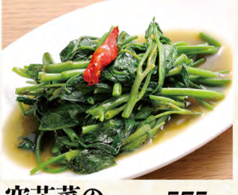
空芯菜の中華炒め 575円 (税込621円)