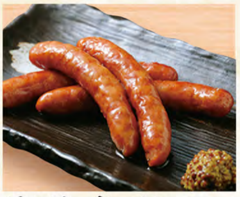
ラムソーセージ炙り焼き 720円 (税込778円)