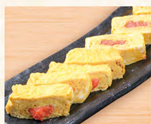
明太出汁巻き玉子 576円 (税込623円)