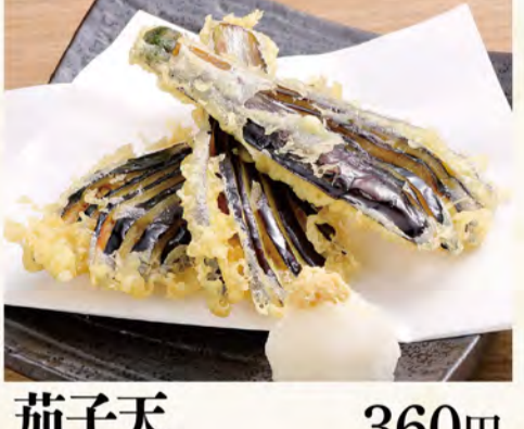
茄子天 360円 (税込389円)