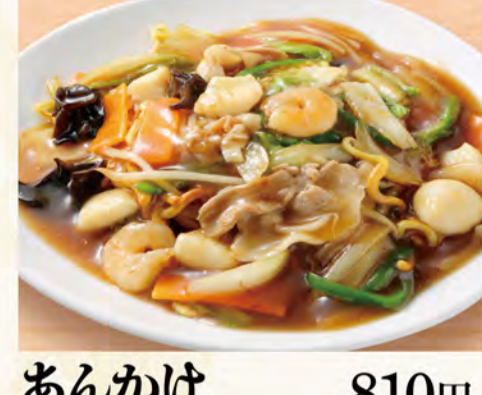
あんかけ焼きそば 810円 (税込875円)