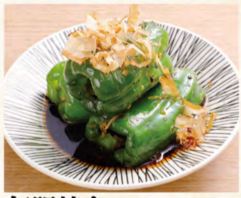
無限焼きピーマン 431円 (税込466円)