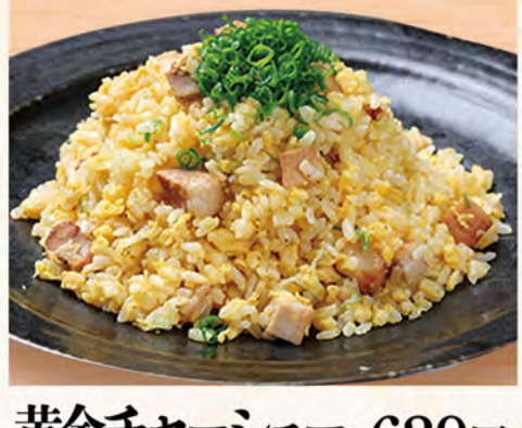
黄金チャーシュー炒飯 629円 (税込680円)