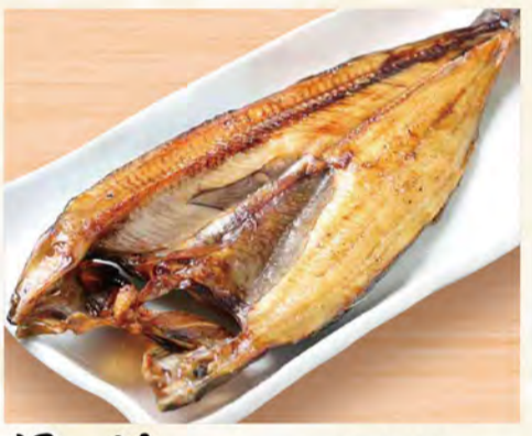
ほっけ 899円 (税込971円)