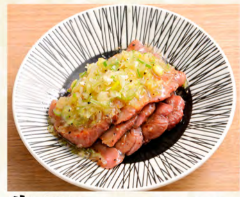
牛タン葱みれ 1,152円 (税込1,245円)