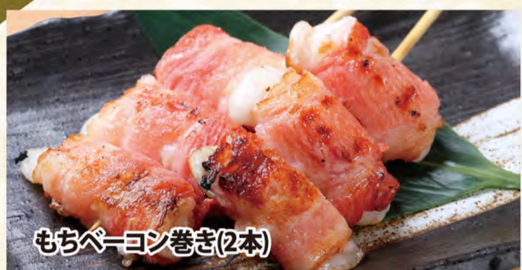
もちベーコン巻き(2本)