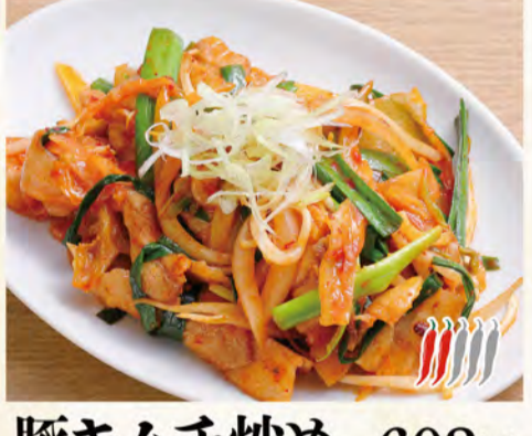
豚キムチ炒め 602円 (税込651円)