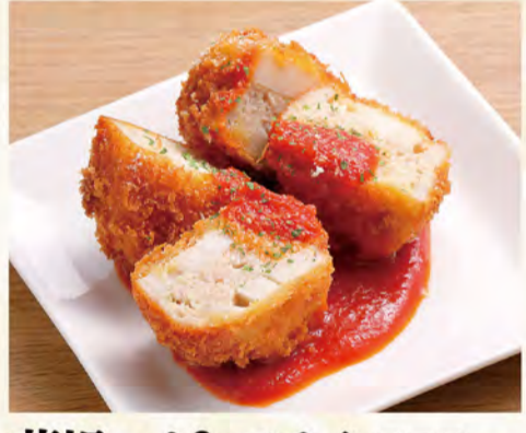
蓮根つくねフライ トマトソース 575円 (税込621円)