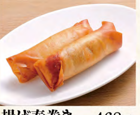
揚げ春巻き 468円 (税込506円)