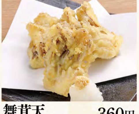
舞茸天 360円 (税込389円)