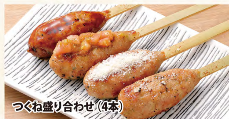
つくね盛り合わせ(4本)