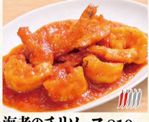
海老のチリソース 810円 (税込875円)