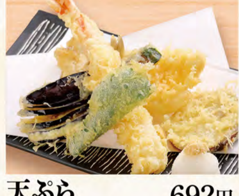
天ぷら盛り合わせ 692円 (税込748円)