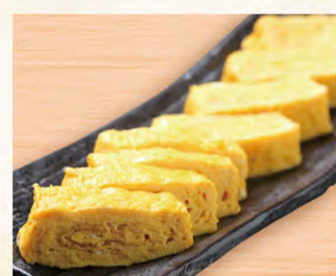
出汁巻き玉子 521円 (税込563円)