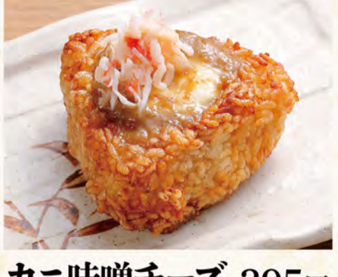
カニ味噌チーズ焼きおにぎり 395円 (税込427円)