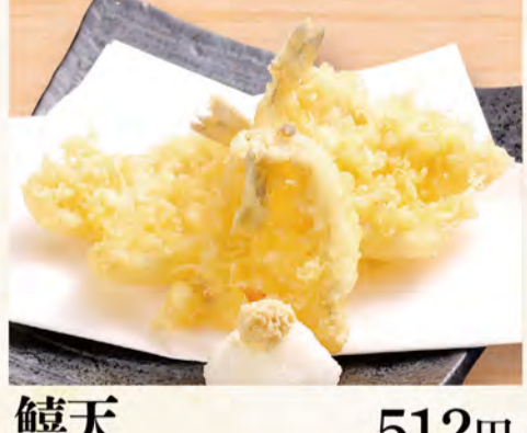
鱈天 512円 (税込553円)