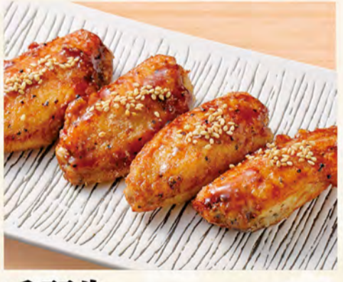
手羽先から揚げ(4本) 477円 (税込516円)