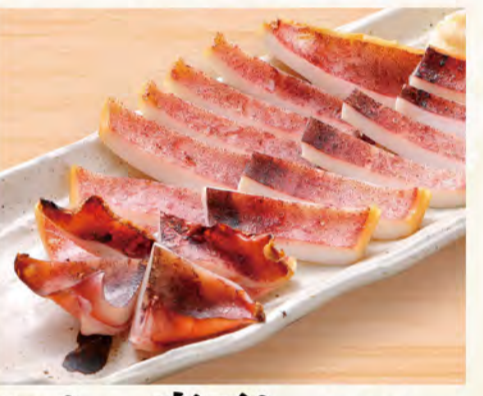
いか一夜干し 801円 (税込866円)