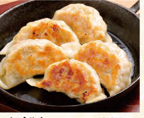
三元豚ジャンボ餃子 630円 (税込681円)