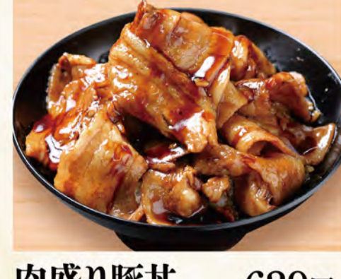
肉盛り豚丼 629円 (税込680円)