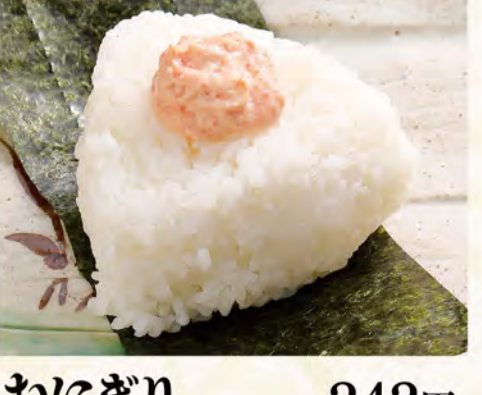
おにぎり 明太マヨチーズ 242円 (税込262円)