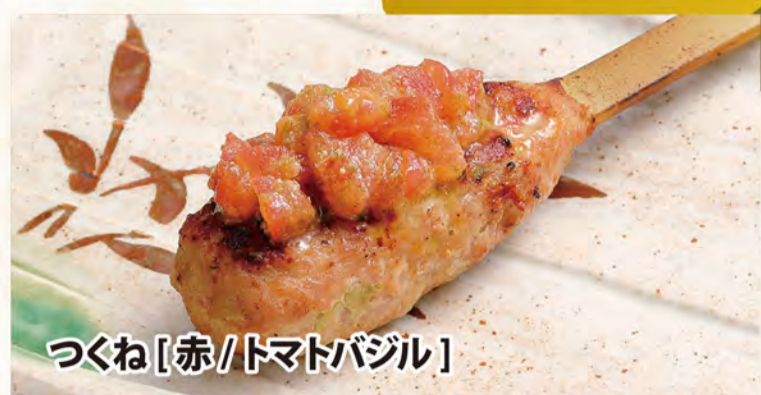
つくね [赤/トマトバジル]