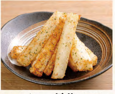
スパイシー長芋 512円 (税込553円)