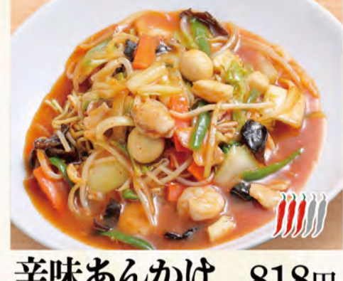
辛味あんかけ焼きそば 818円 (税込884円)