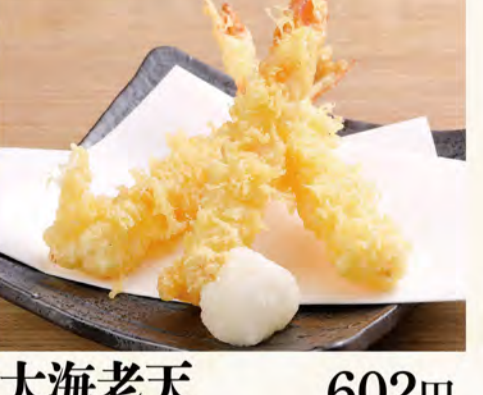
大海老天 602円 (税込651円)