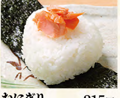
おにぎり 鮭 215円 (税込233円)