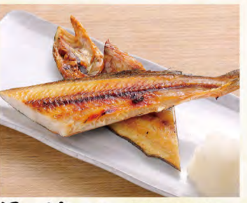
ほっけ ハーフ 540円 (税込584円)