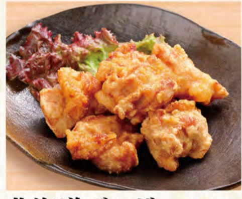
北海道ザンギ(6個) 575円 (税込621円)