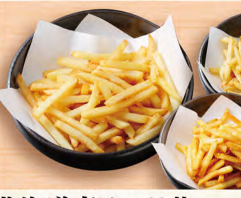
北海道産じゃが芋カルビーポテトフライ 各485円 (税込524円)