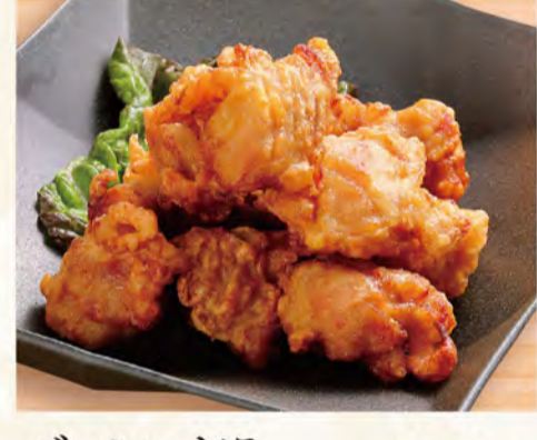
でっかいどう ザンギ盛り(10個) 810円 (税込875円)