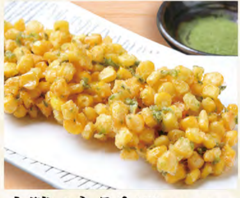
十勝のとうきびかき揚げ 521円 (税込563円)