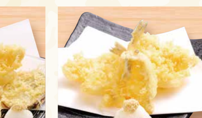
天ぷら 盛り合わせ 778円 (税込841円)