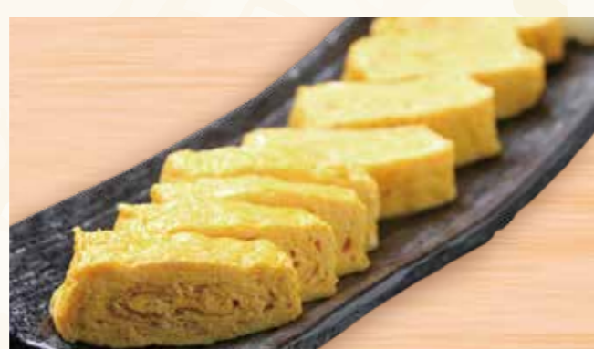
出汁巻き玉子 588円 (税込636円)