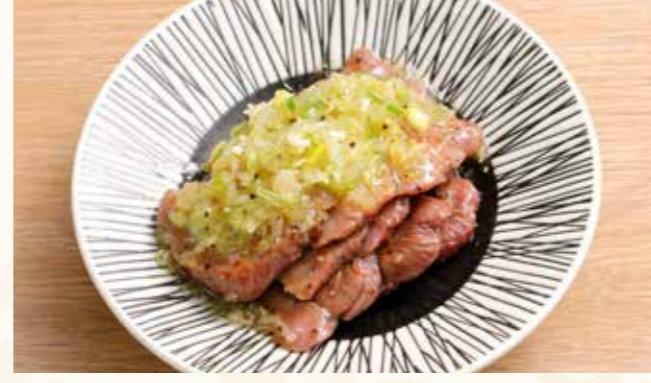
牛タン葱まみれ 1,380円 (税込1,491円)