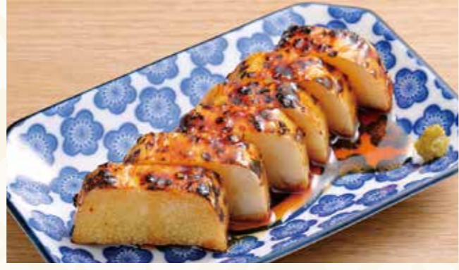
長芋炙り 柚子胡椒タレ 568円 (税込614円)