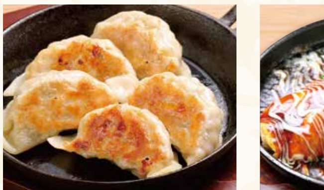
三元豚 ジャンボ餃子 728円 (税込787円)