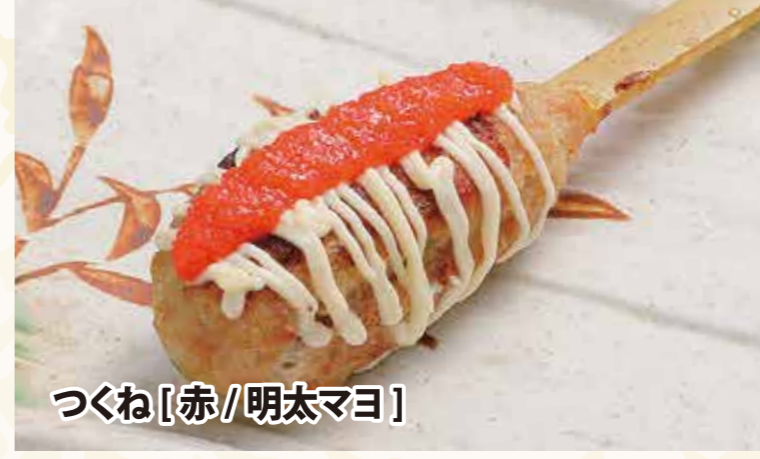
つくね[赤/明太マヨ]