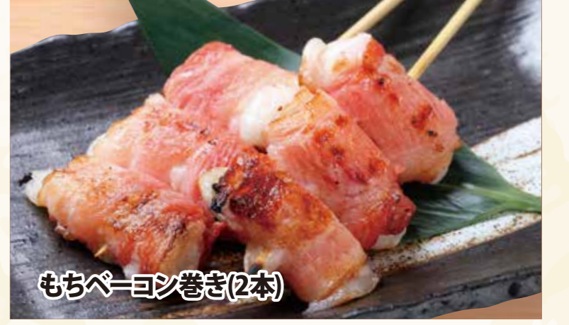
もちベーコン巻き(2本)