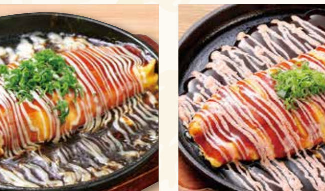
とんべい焼き レギュラー 569円 (税込615円)