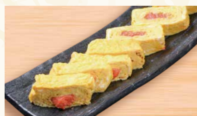
明太出汁巻き玉子 659円 (税込712円)