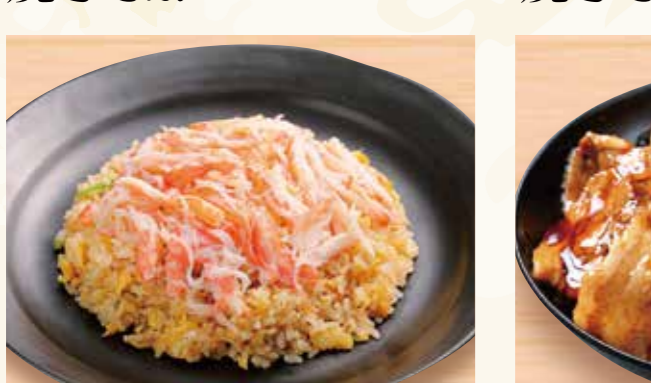
山盛り スワイガニ炒飯 990円 (税込1,070円)