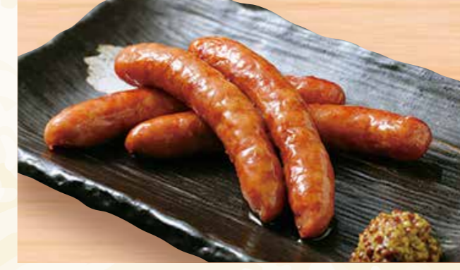
ラムソーセージ 炙り焼き 818円 (税込884円)