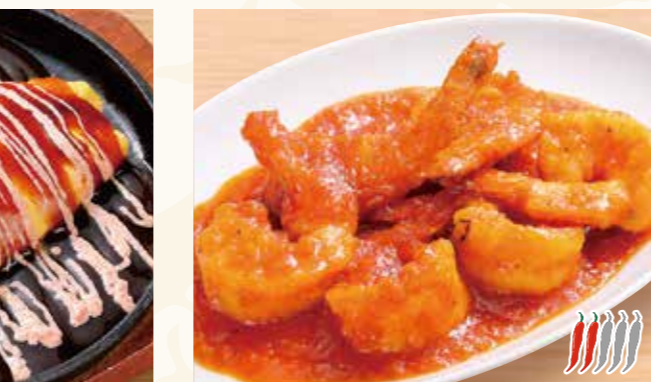
とんべい焼き 明太マヨ 599円 (税込647円)