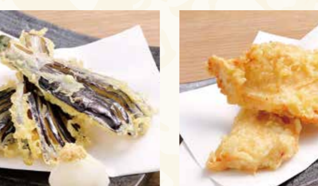
舞茸天 418円 (税込452円)