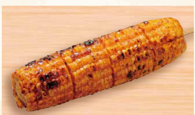
札幌大通名物 丸ごと焼きとうきび 598円 (税込646円)