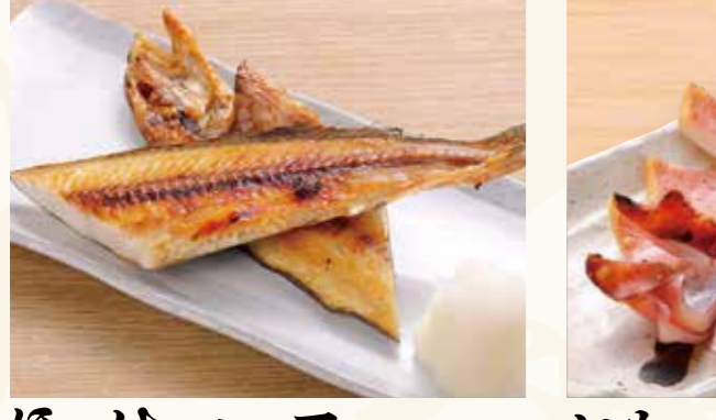
ほっけ ハーフ 599円 (税込647円)