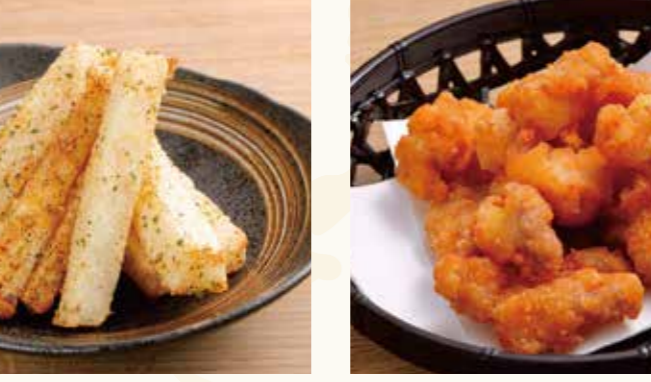
スパイシー長芋 578円 (税込625円)