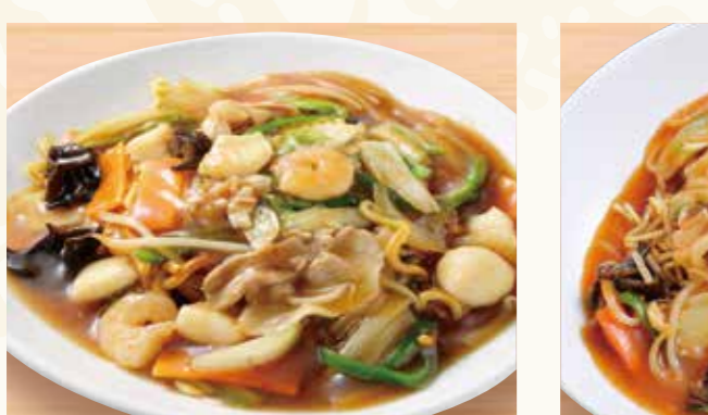
あんかけ 焼きそば 938円 (税込1,014円)