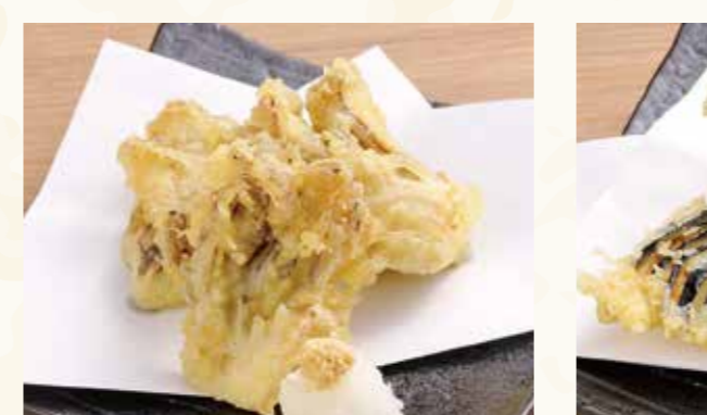
鱈天 568円 (税込614円)