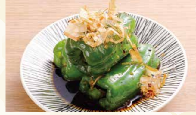
無限焼きピーマン 488円 (税込528円)