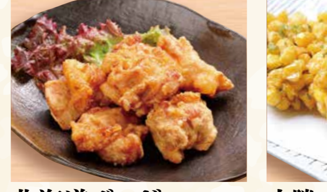
でっかいどろ ザンギ盛り(10個) 999円 (税込1,079円)