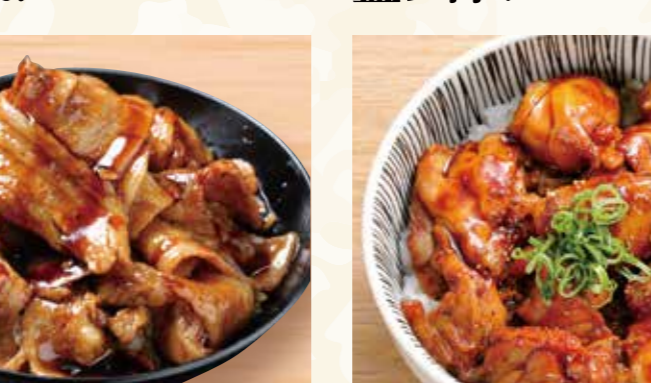
肉盛り豚丼 698円 (税込754円)