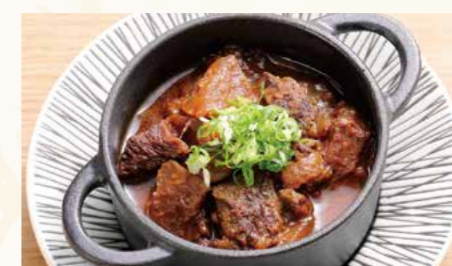
牛すじのどて焼き 688円 (税込744円)