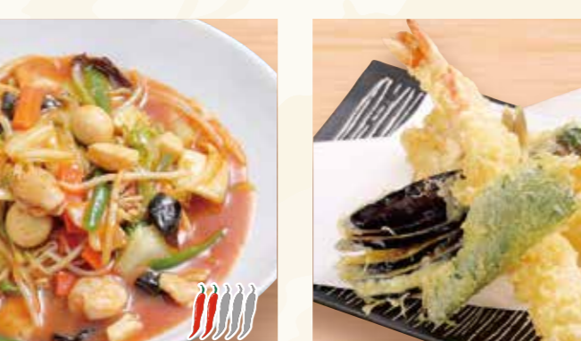
辛味あんかけ 焼きそば 958円 (税込1,035円)