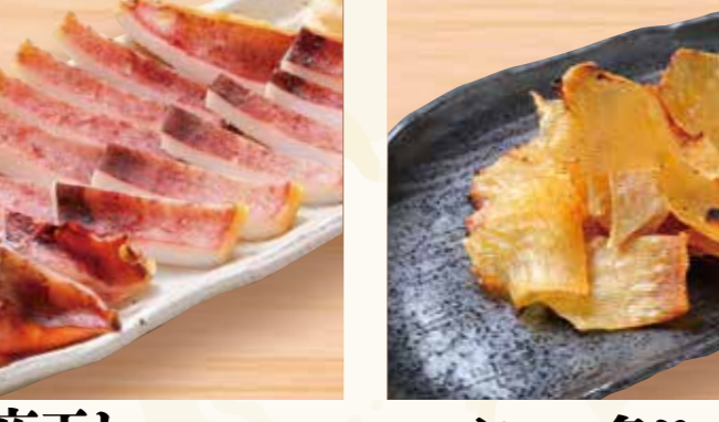
いか一夜干し 1,180円 (税込1,275円)