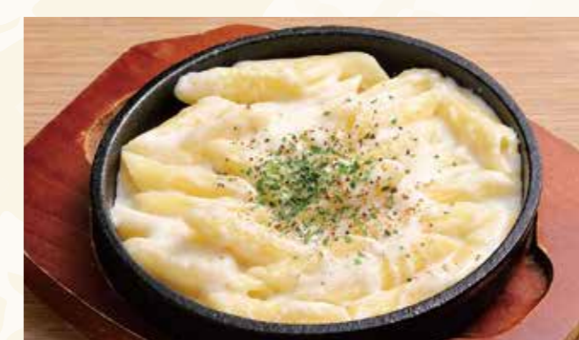
ゴルゴンゾーラペンネ 558円 (税込603円)