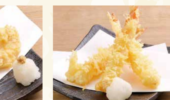
茄子天 418円 (税込452円)