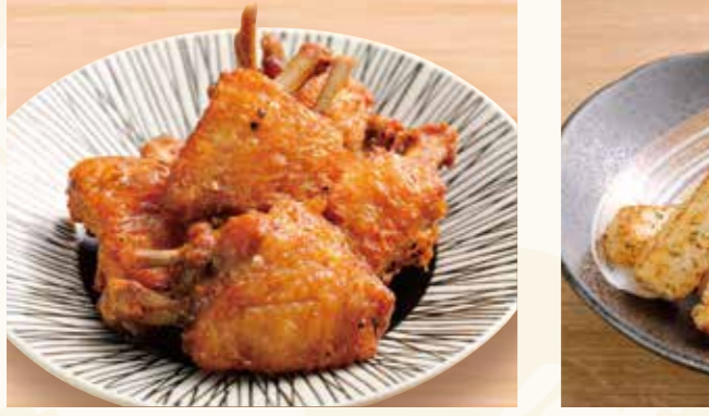
山の猿の手羽チュー 1本 178円~ (税込193円~)