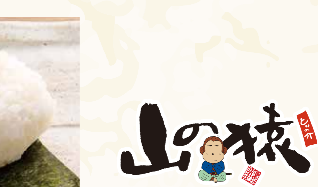
おにぎり 鮭 238円 (税込258円)