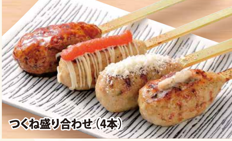
つくね盛り合わせ (4本)