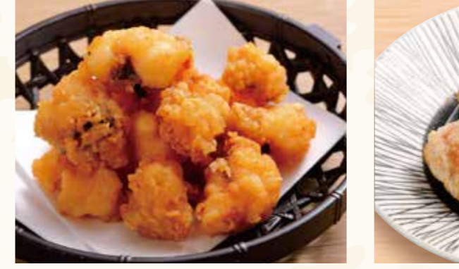
ピリ辛 軟骨唐揚げ 648円 (税込700円)