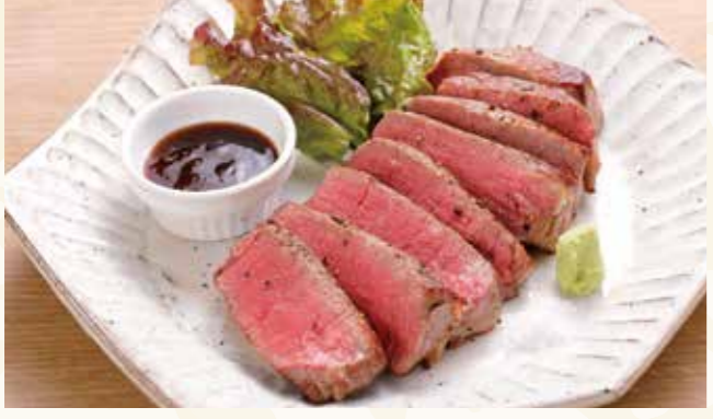
牛フィレステーキ 1,799円 (税込1,943円)