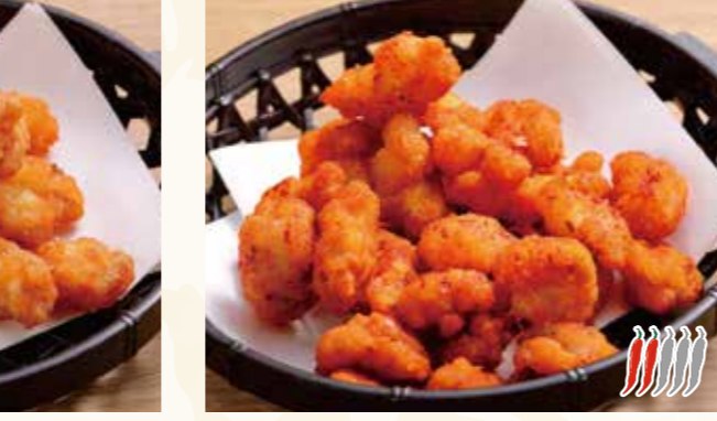
軟骨から揚げ 618円 (税込668円)