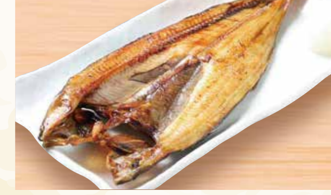
ほっけ 998円 (税込1,078円)