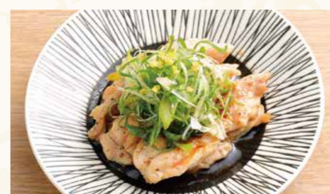
せせりと九条葱のゆずポン酢 658円 (税込711円)