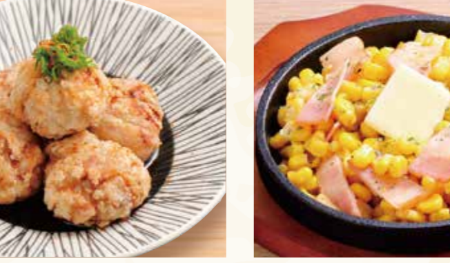
タコザンギ 618円 (税込668円)