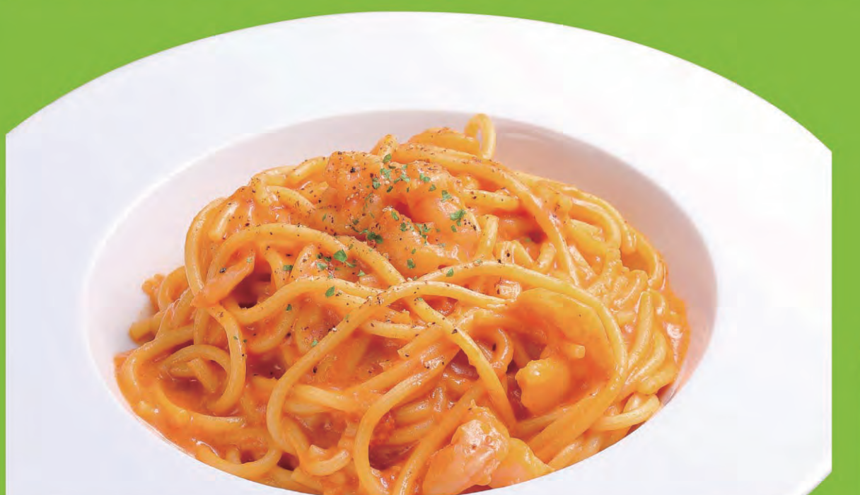
ビスク風トマトクリームパスタ ¥928 (税込1,021円)