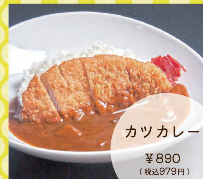
カツカレー ¥890 (税込979円)