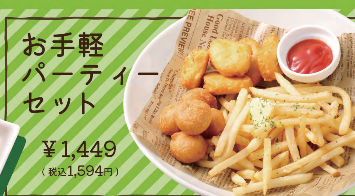
お手軽パーティーセット ¥1,449 (税込1,594円)