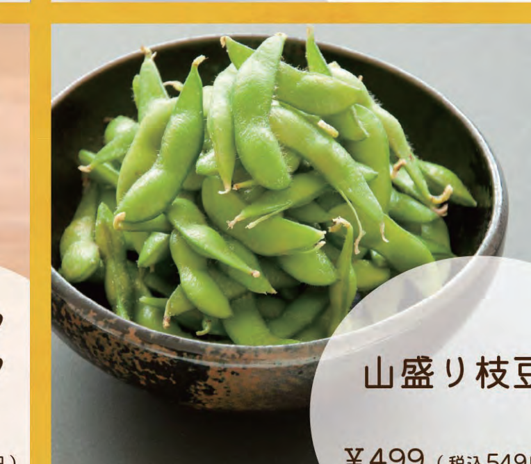
山盛り枝豆 ¥499 (税込549円)