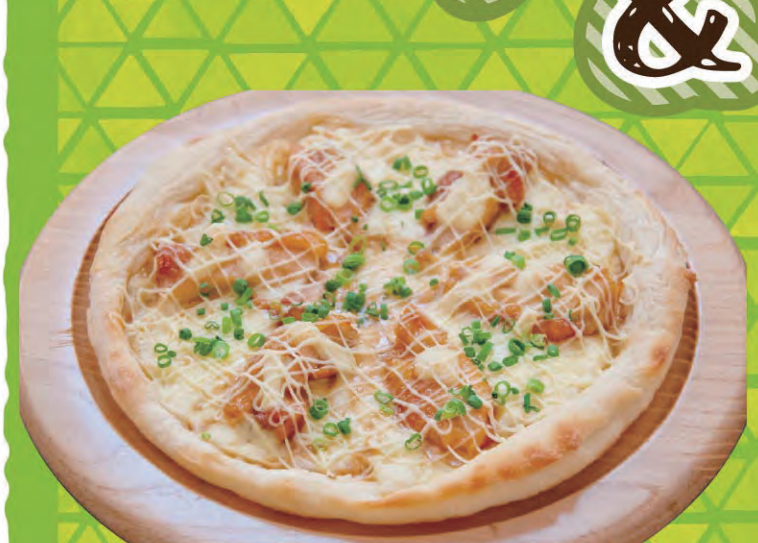
テリヤキチキン ¥848 (税込933円)