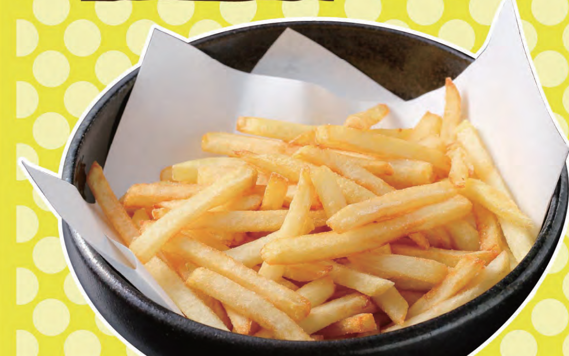
北海道産じゃが芋カルビーポテトフライ 各 ¥558 (税込614円)