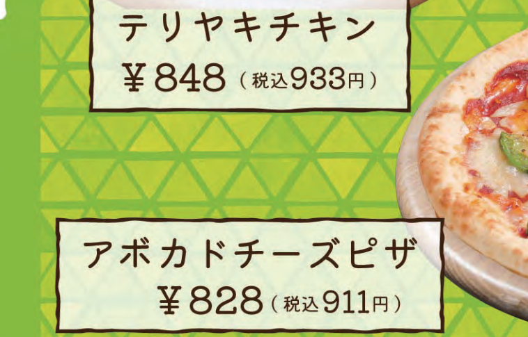
アポカドチーズピザ ¥828 (税込911円)