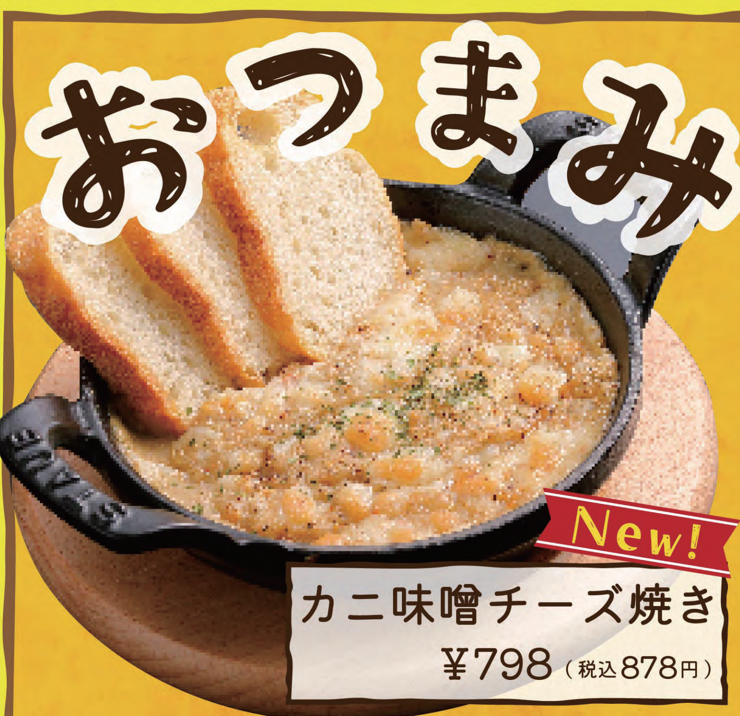
カニ味噌チーズ焼き ¥798 (税込878円)