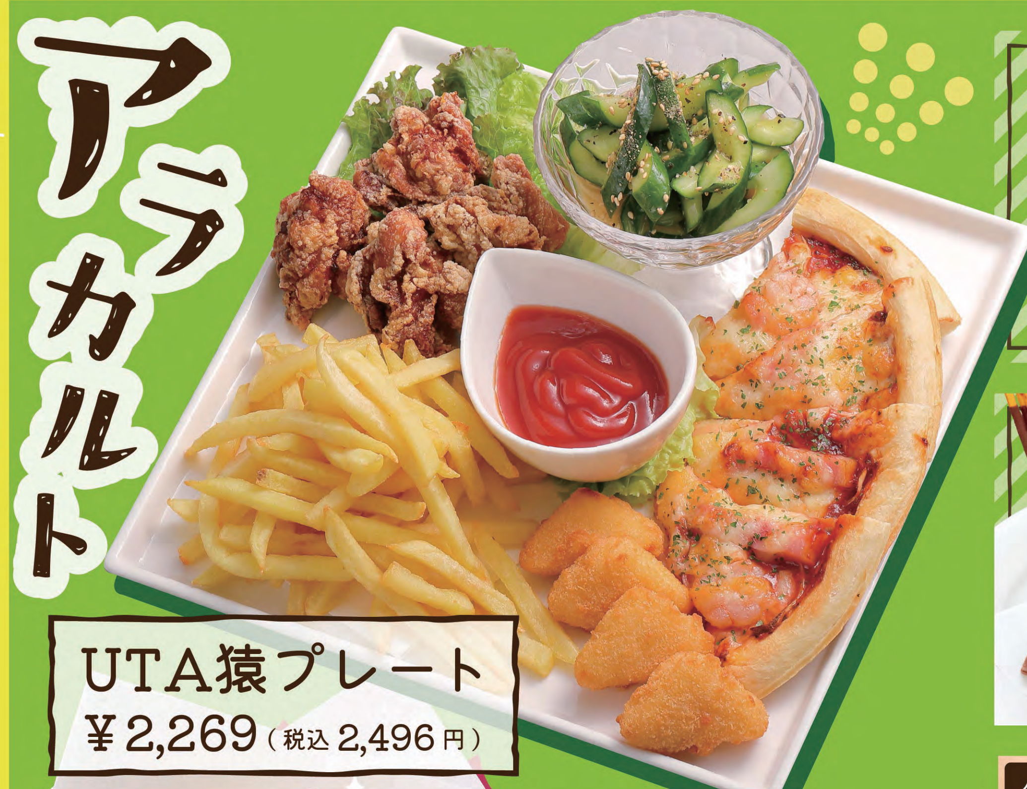
UTA猿プレート ¥2,269 (税込2,496円)