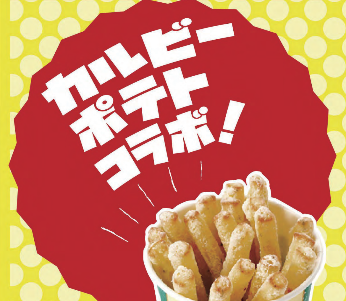
ポテリコ ¥458 (税込499円)