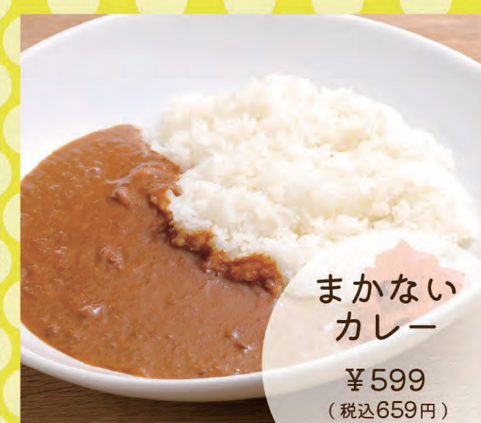
まかないカレー ¥599 (税込659円)