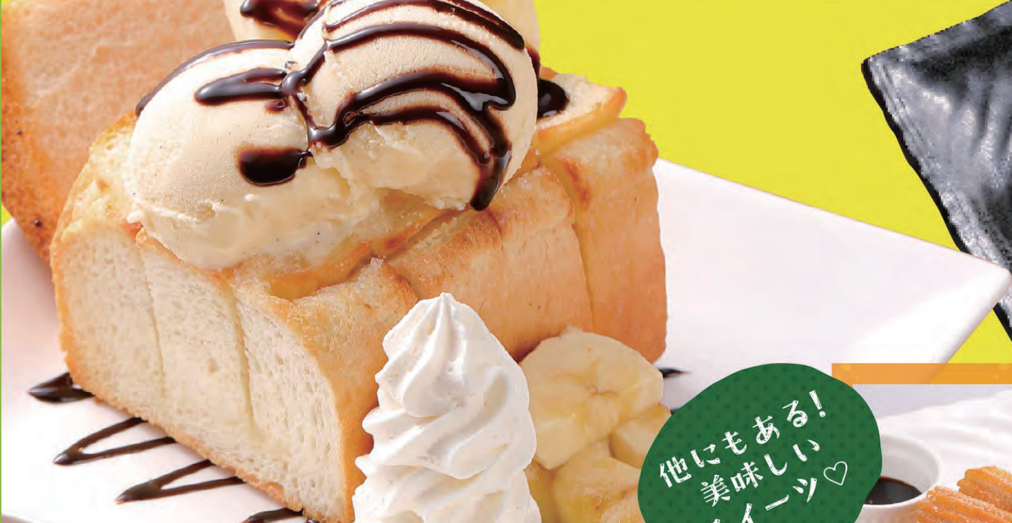
チョコバナナハニートースト ¥799 (税込879円)