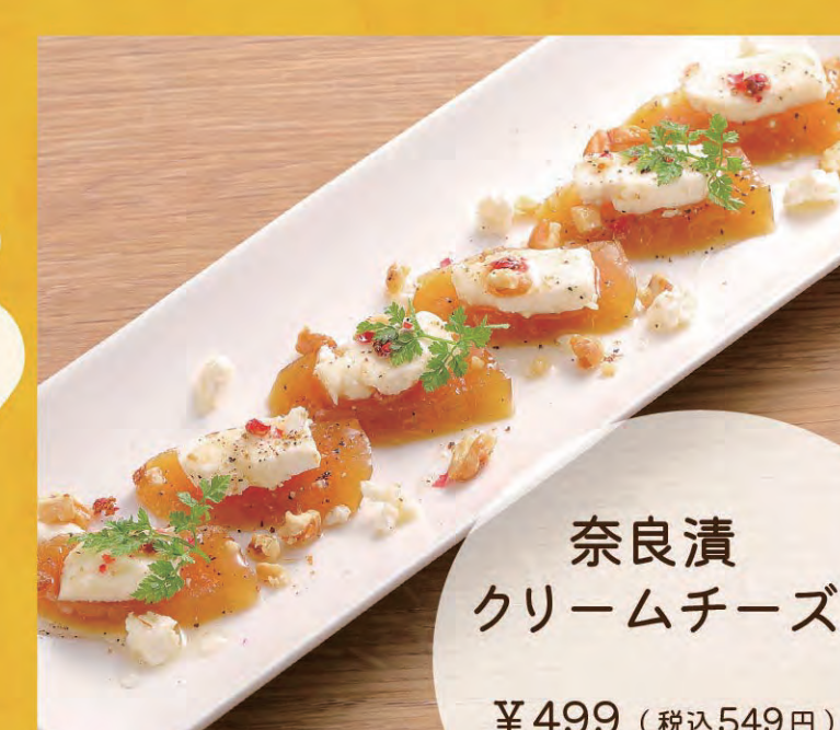
奈良漬クリームチーズ ¥499 (税込549円)