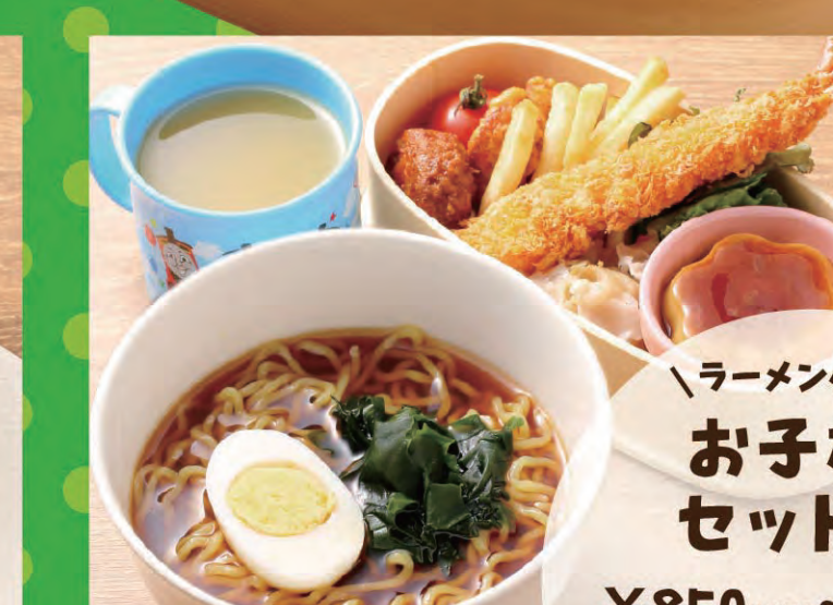
お子様ランチC ¥850 (税込935円)