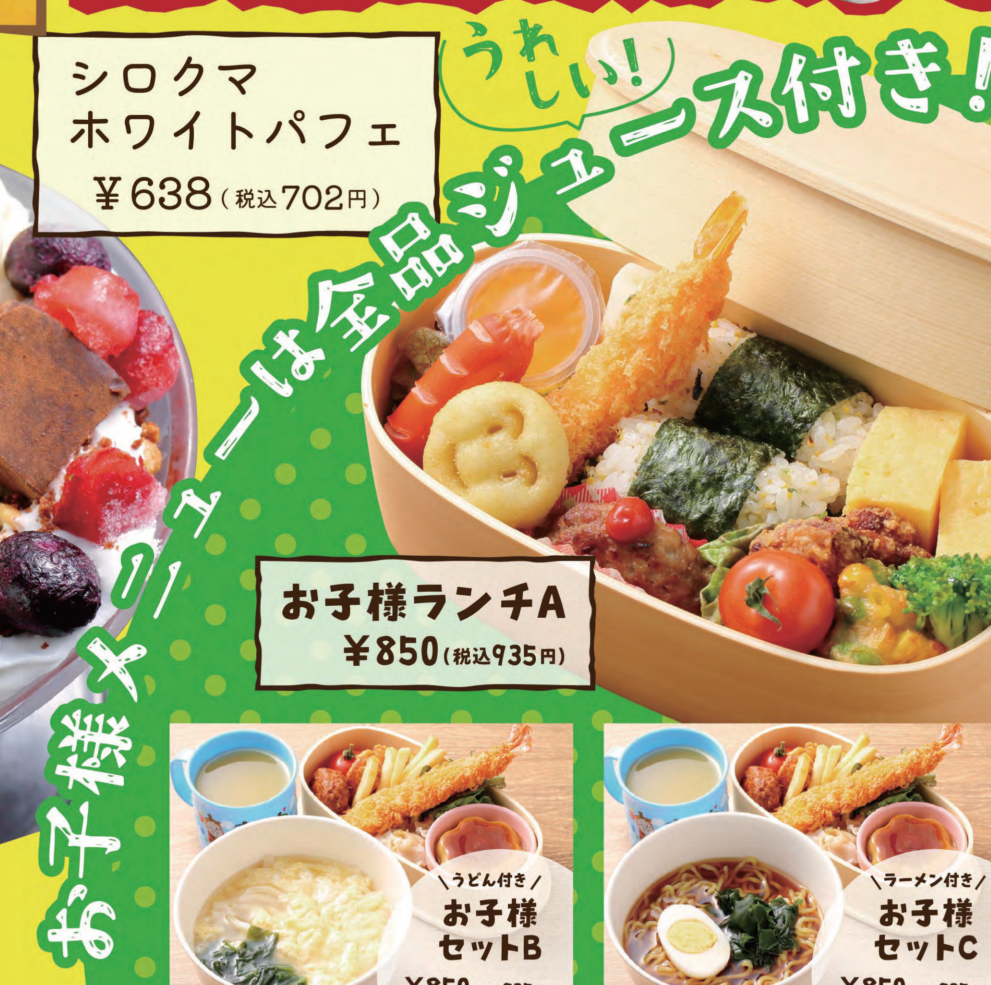
お子様ランチA ¥850 (税込935円)