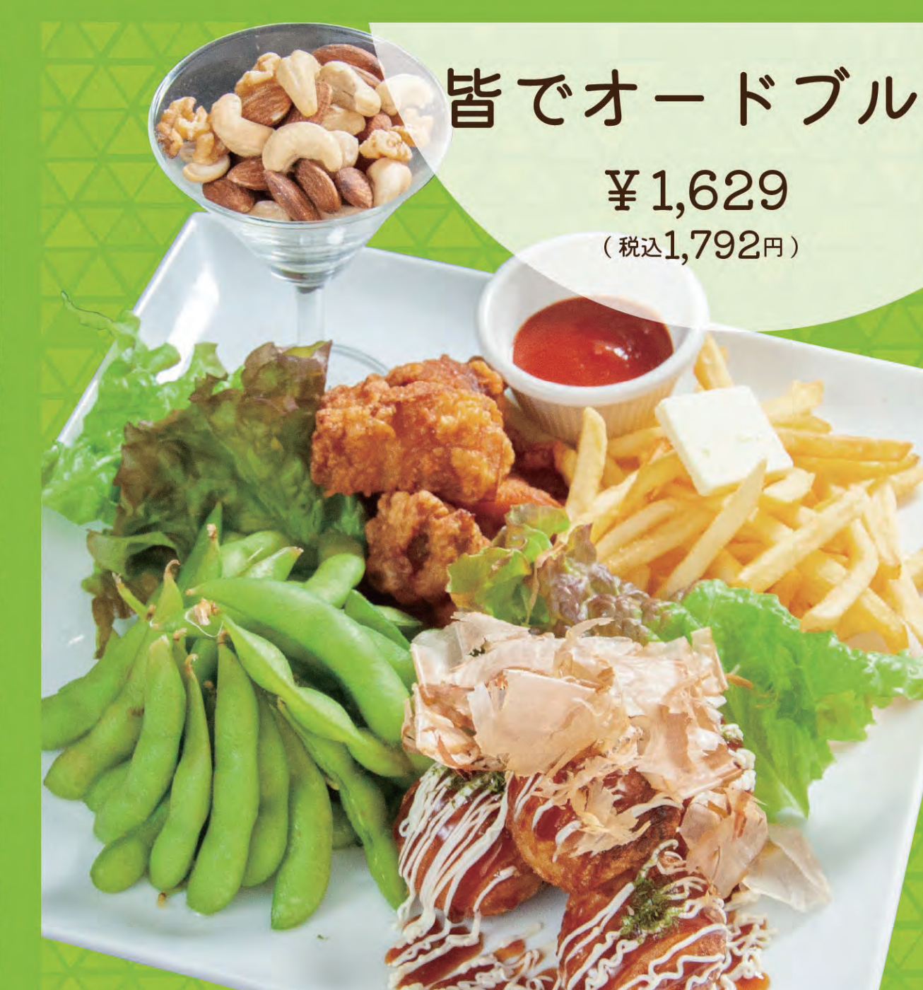
皆でオードブル ¥1,629 (税込1,792円)