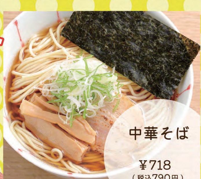
中華そば ¥718 (税込790円)