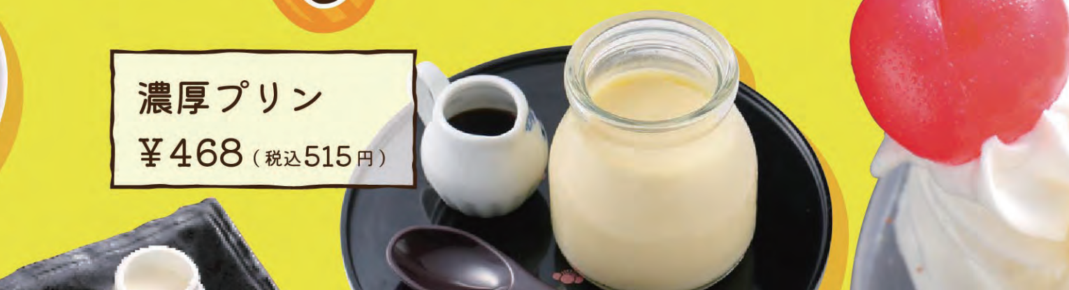
濃厚プリン ¥468 (税込515円)