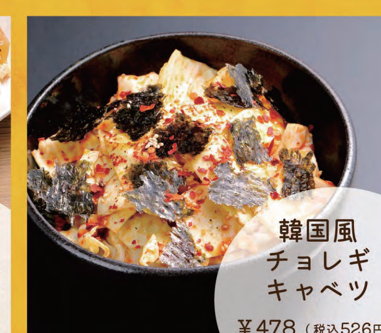
韓国風チョレギキャベツ ¥478 (税込528円)