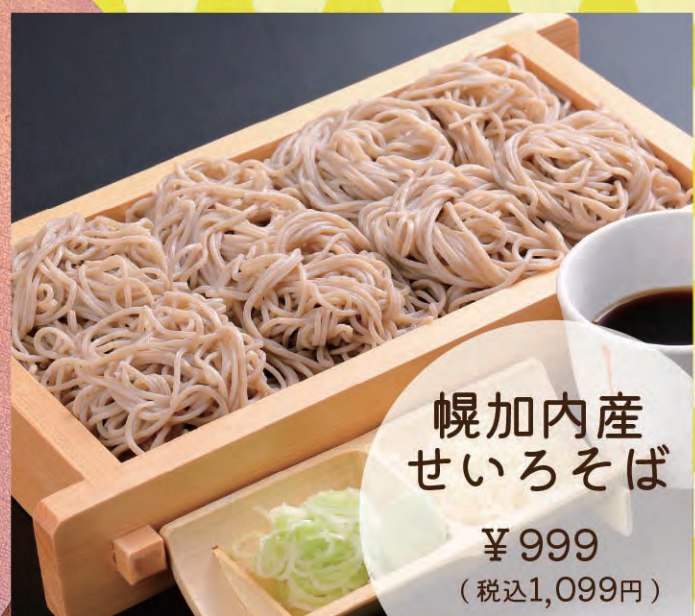
幌加内産せいろそば ¥999 (税込1,099円)