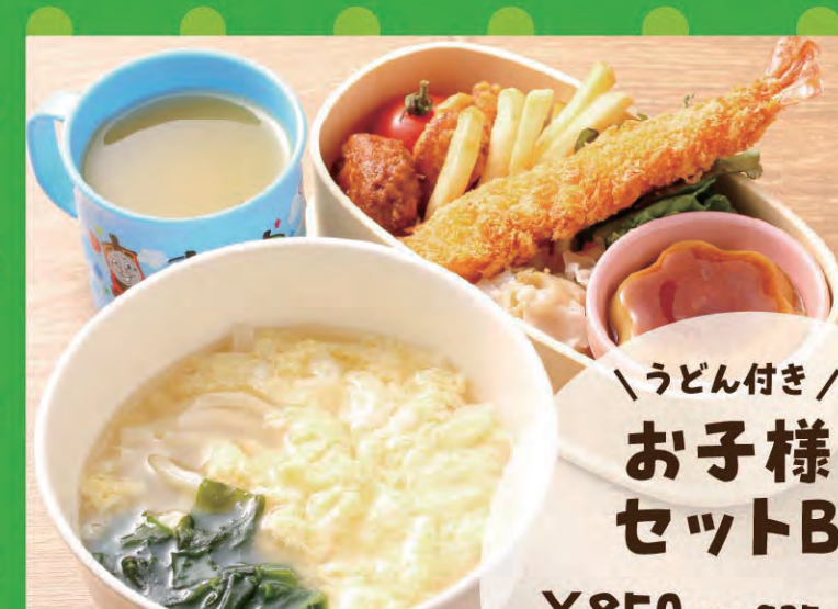
お子様ランチB ¥850 (税込935円)