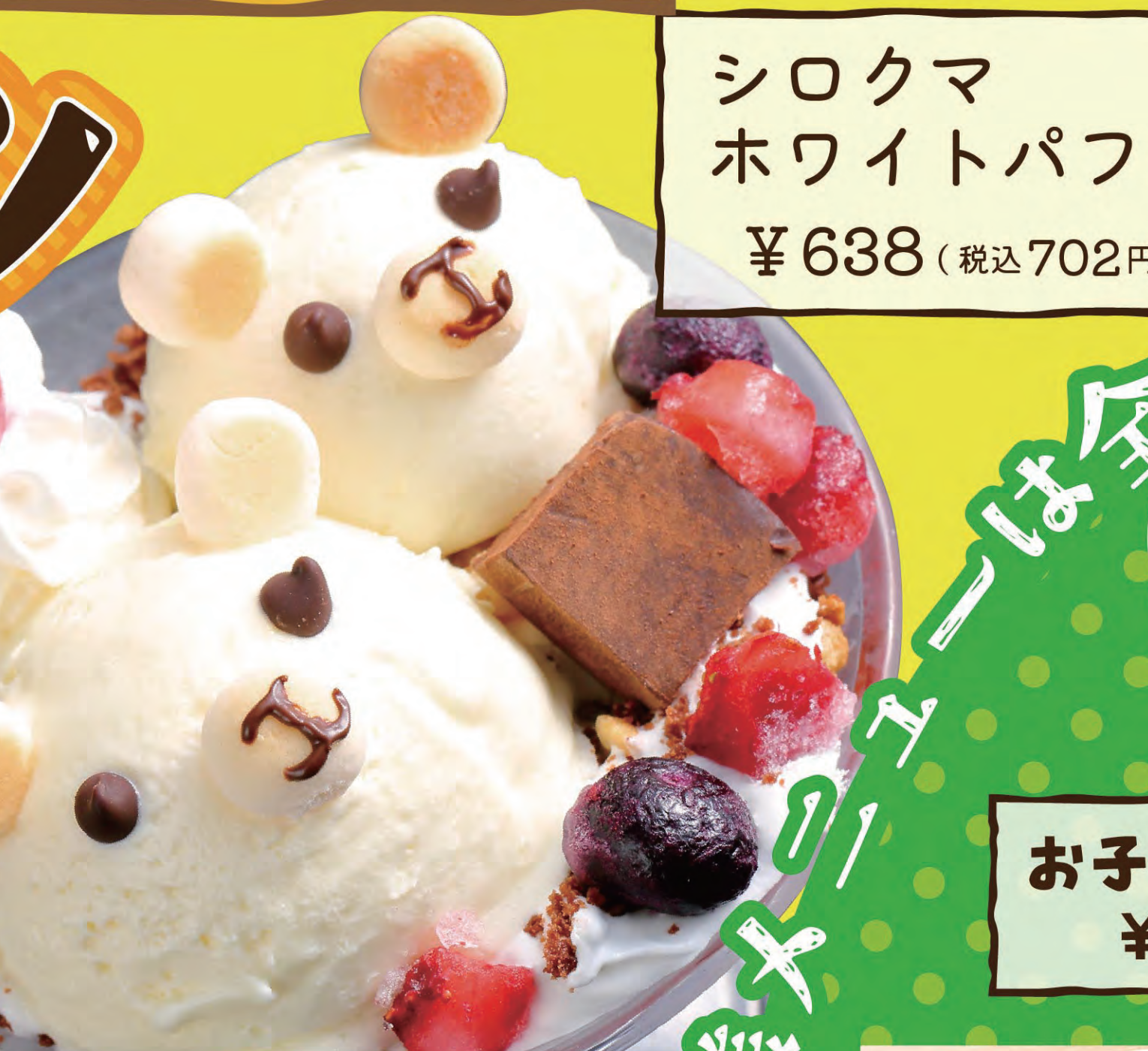
シロクマホワイトパフェ ¥638 (税込702円)