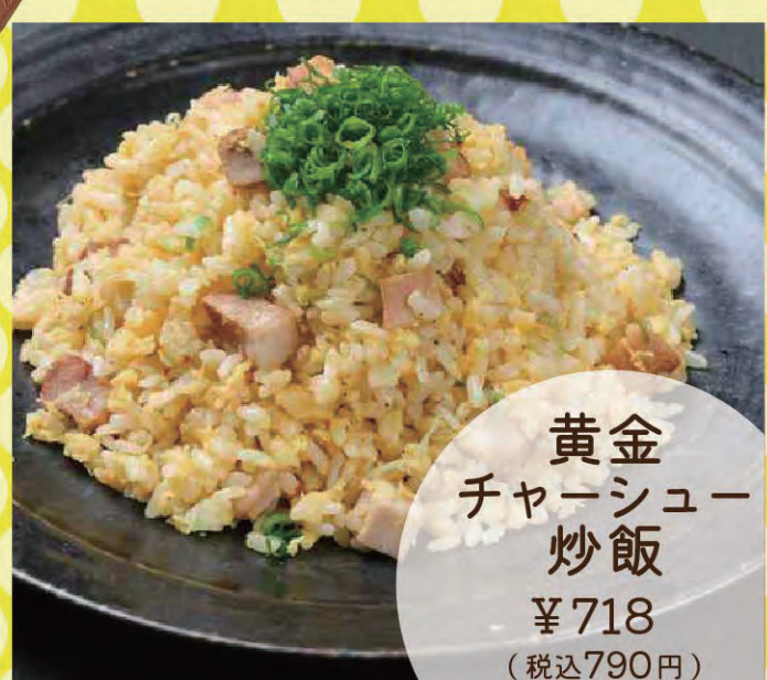
黄金チャーシュー炒飯 ¥718 (税込790円)