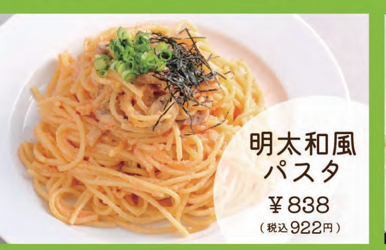
明太和風パスタ ¥838 (税込922円)