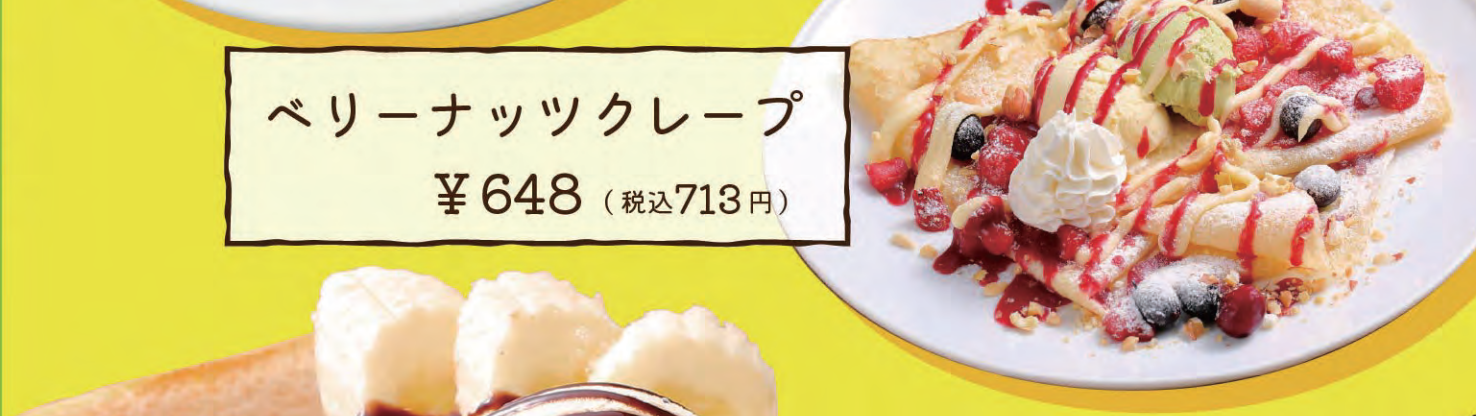
ベリーナッツクレープ ¥648 (税込713円)