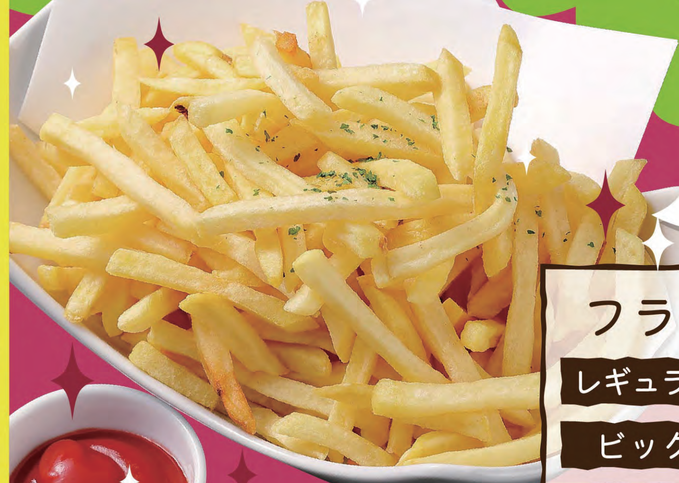
フライドポテト レギュラー ¥499 (税込549円) ビッグ ¥699 (税込769円)