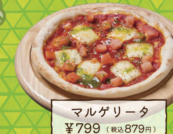
マルゲリータ ¥799 (税込879円)