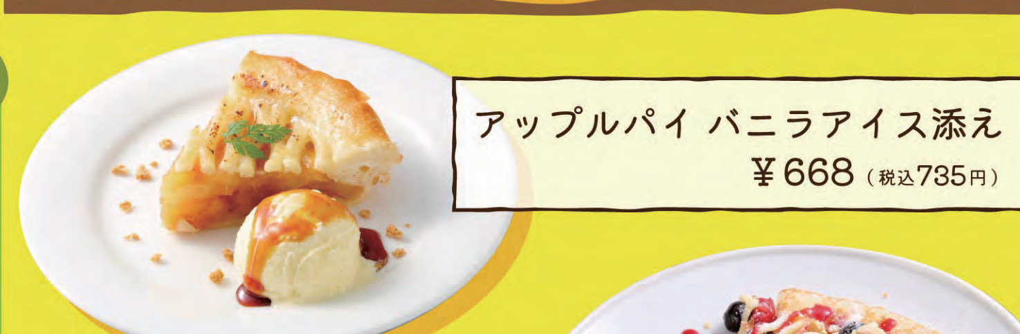
アップルパイ バニラアイス添え ¥668 (税込735円)