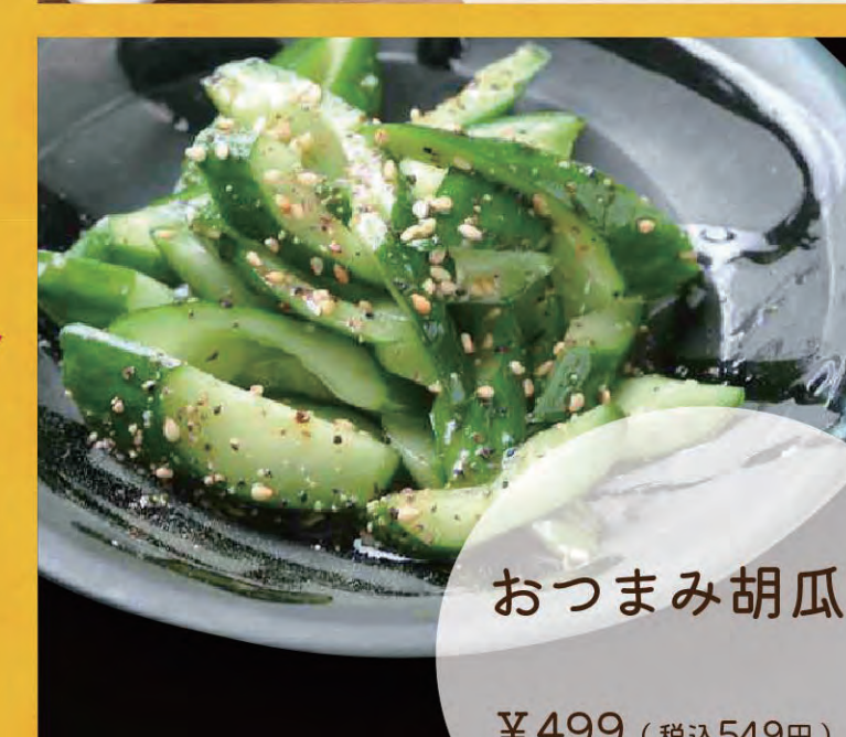
おつまみ胡瓜 ¥499 (税込549円)