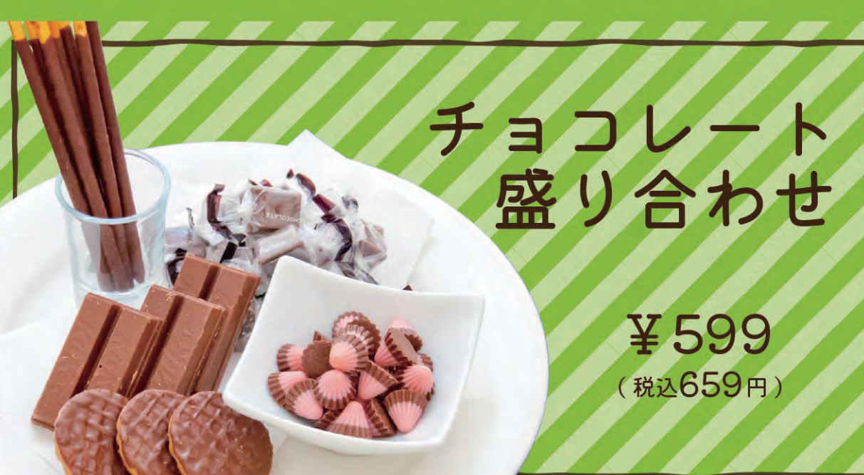
チョコレート盛り合わせ ¥599 (税込659円)