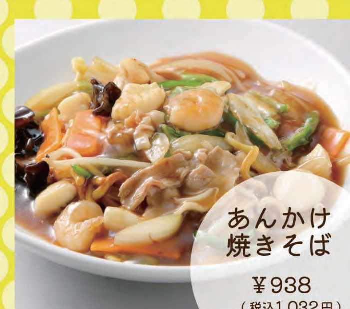
あんかけ焼きそば ¥938 (税込1,032円)