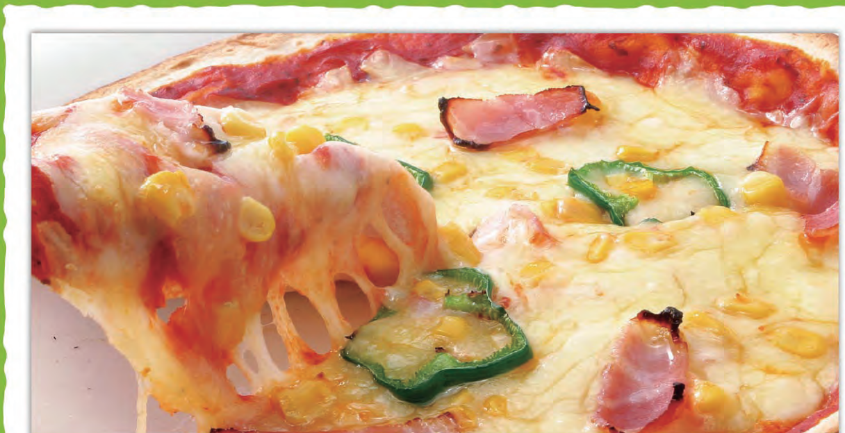
UTA猿ミックスピザ ¥809 (税込890円)