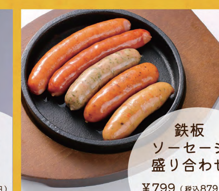
鉄板ソーセージ盛り合わせ ¥799 (税込879円)