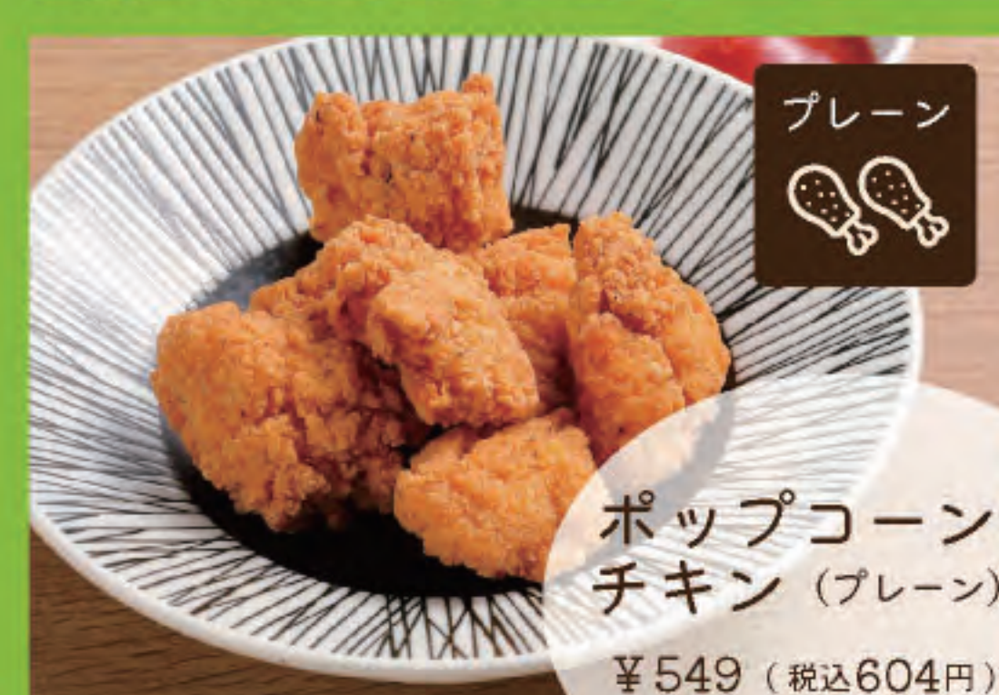
ポップコーンチキン (プレーン) ¥549 (税込604円)