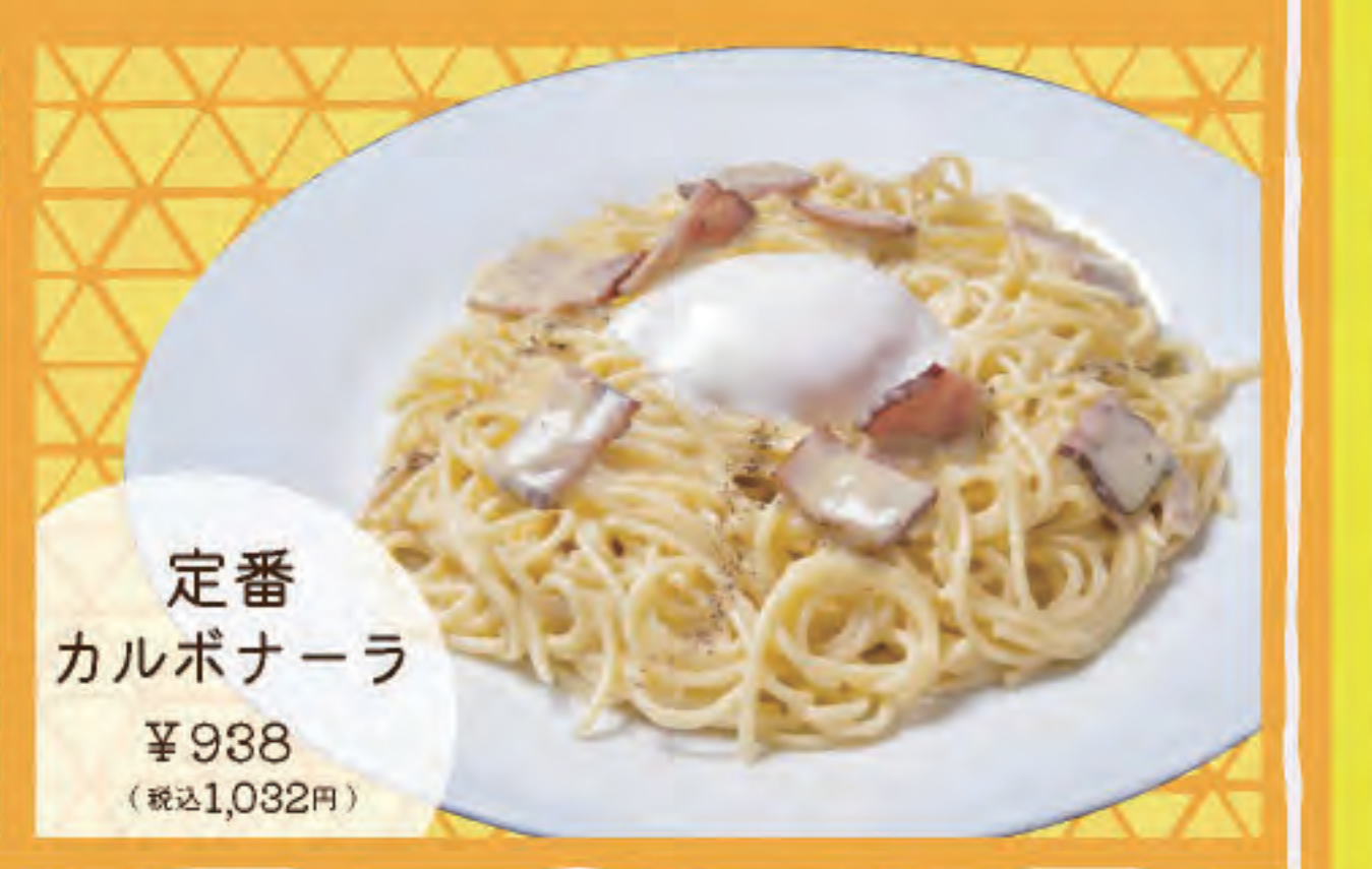
定番カルボナーラ ¥938 (税込1,032円)