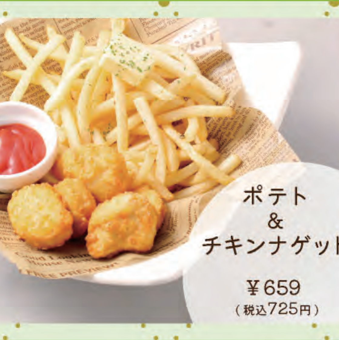
ポテト & チキンナゲット ¥659 (税込725円)