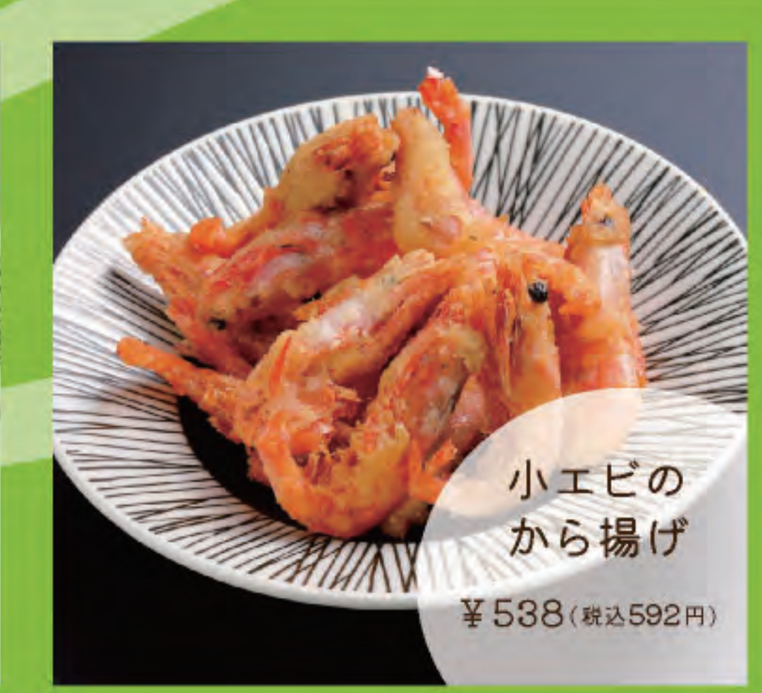
小エビのから揚げ ¥538 (税込592円)