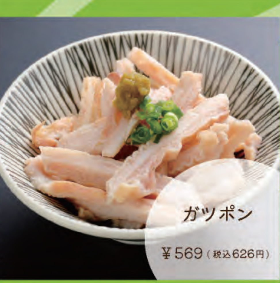
ガツポン ¥569 (税込626円)