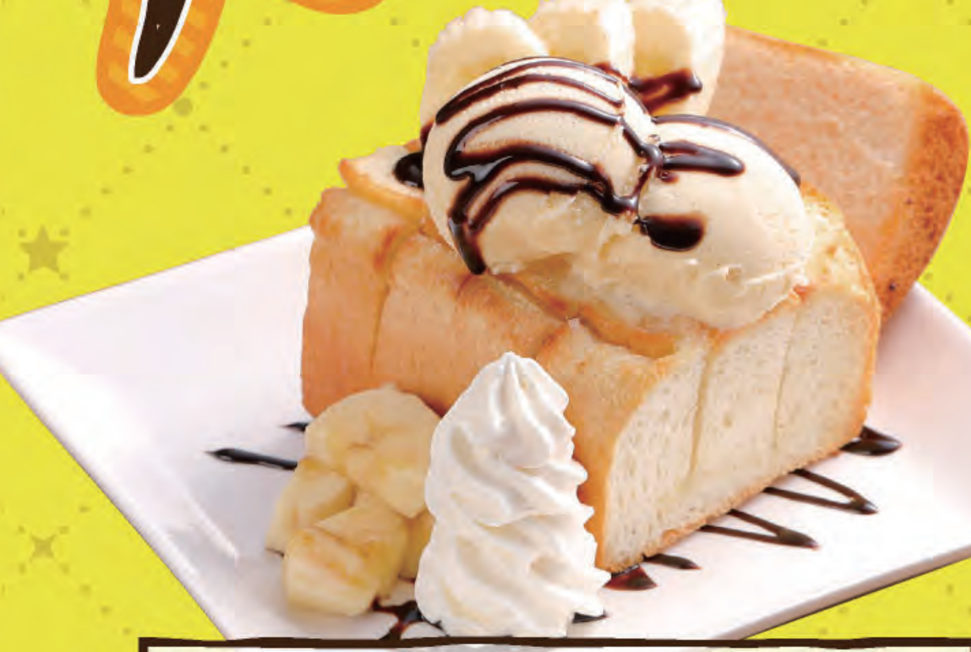
チョコバナナハニートースト ¥799 (税込879円)