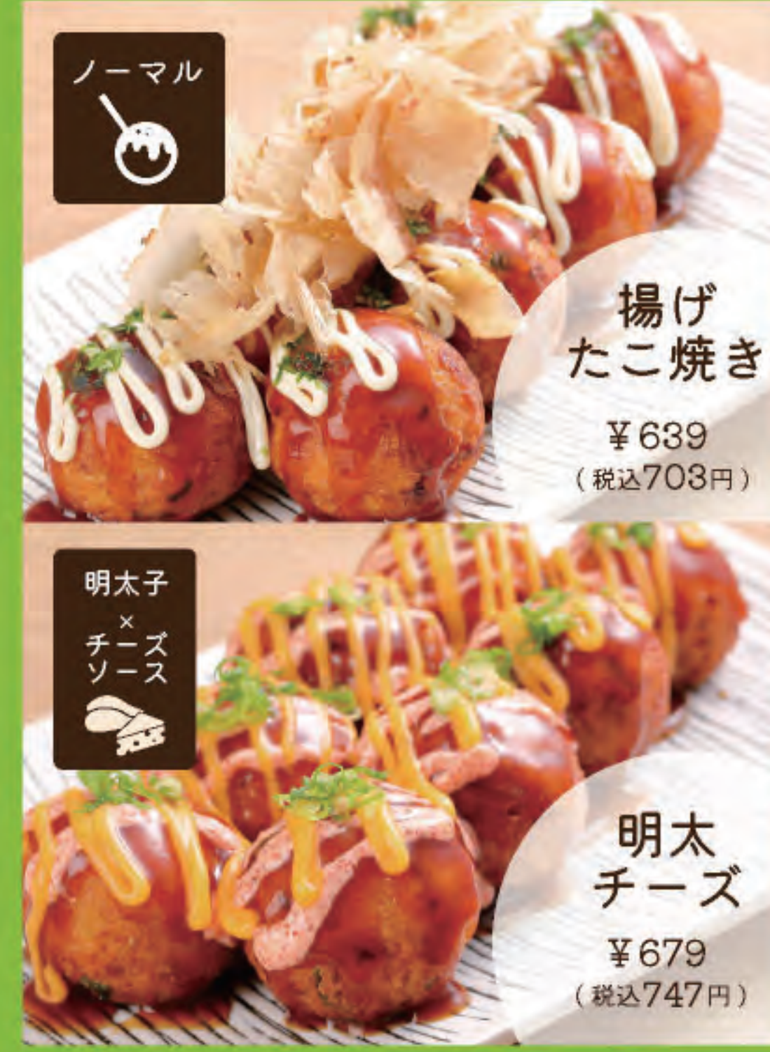
揚げたこ焼き ¥639 (税込703円)