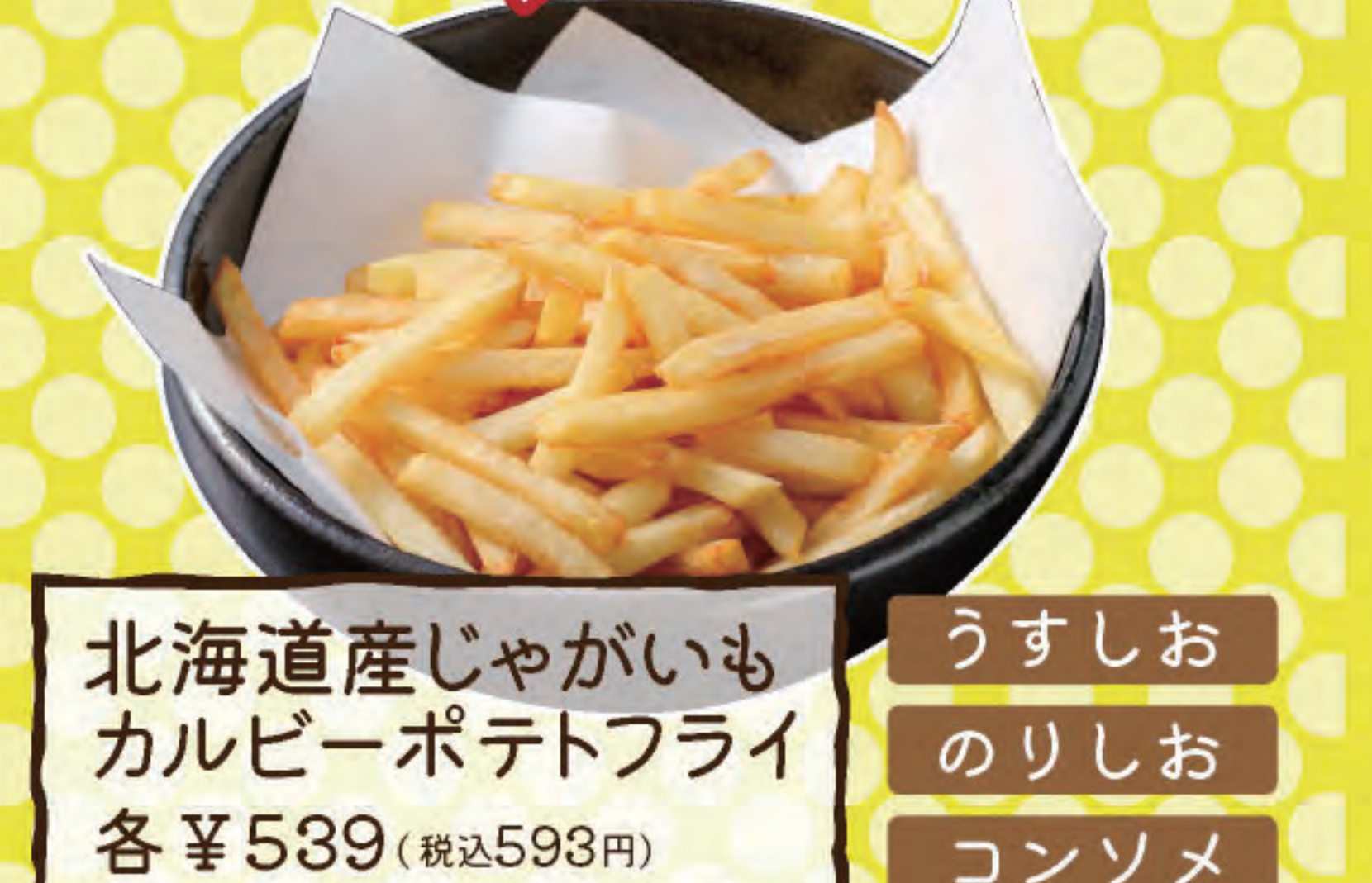
北海道産じゃがいもカルビーポテトフライ 各 ¥539 (税込593円)