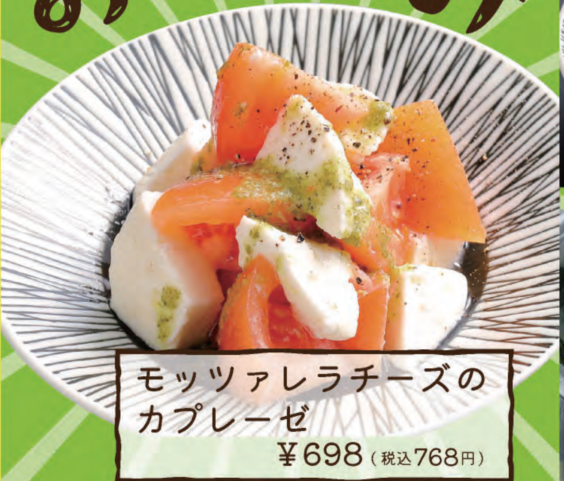
モツアレチーズのカプレーゼ ¥698 (税込768円)