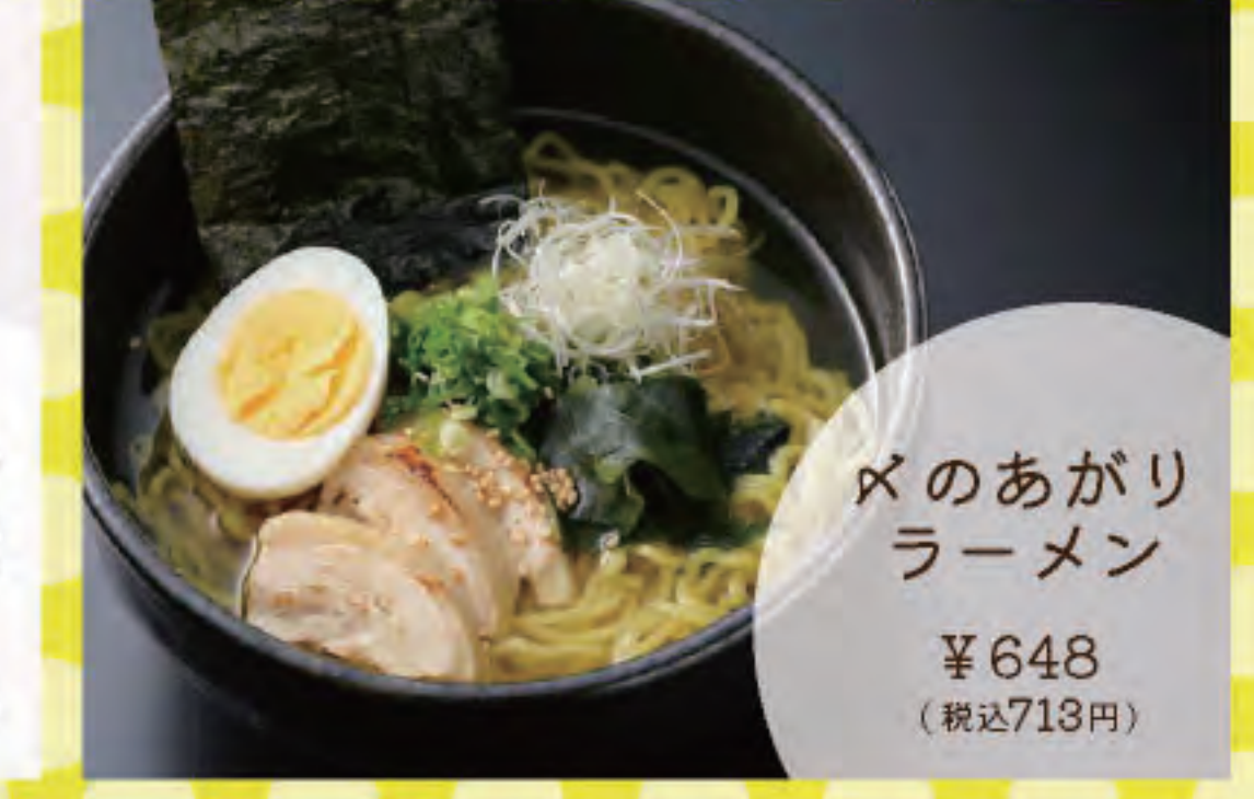
べのあがりラーメン ¥648 (税込718円)