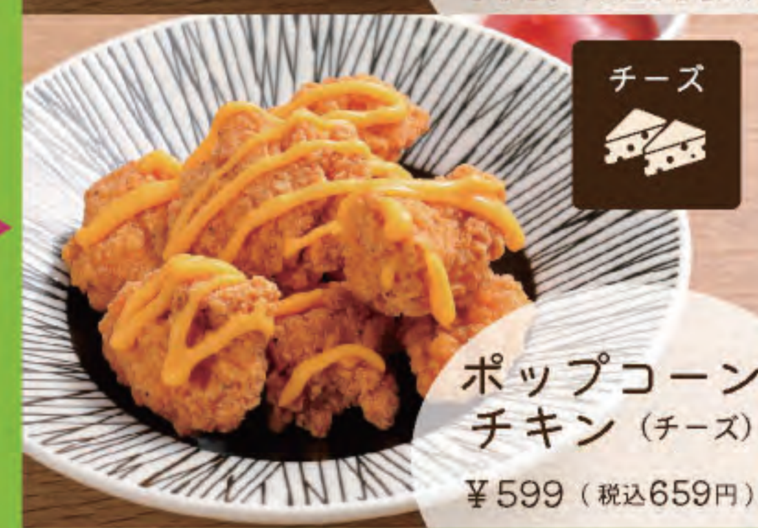
ポップコーンチキン (チーズ) ¥599 (税込659円)