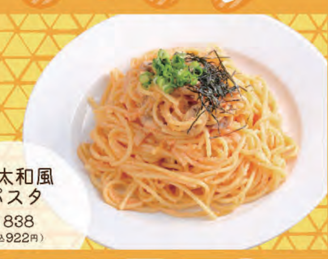
明木和風パスタ ¥688 (税込748円)