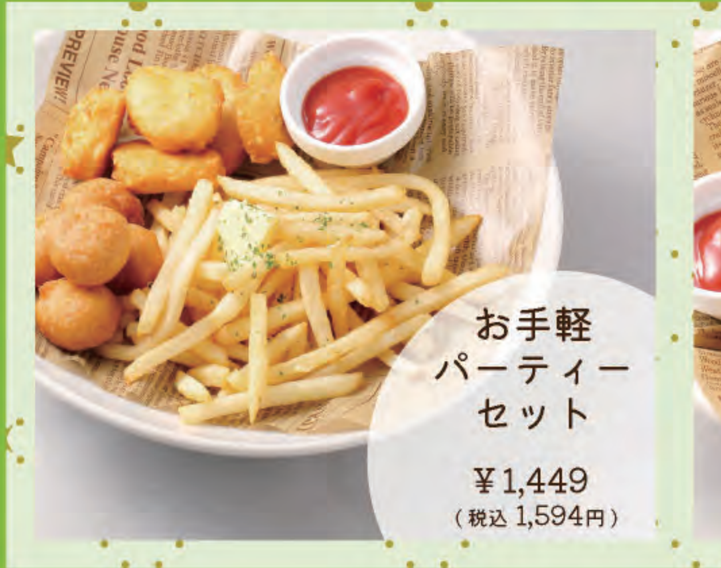
お手軽パーティーセット ¥1,449 (税込1,594円)