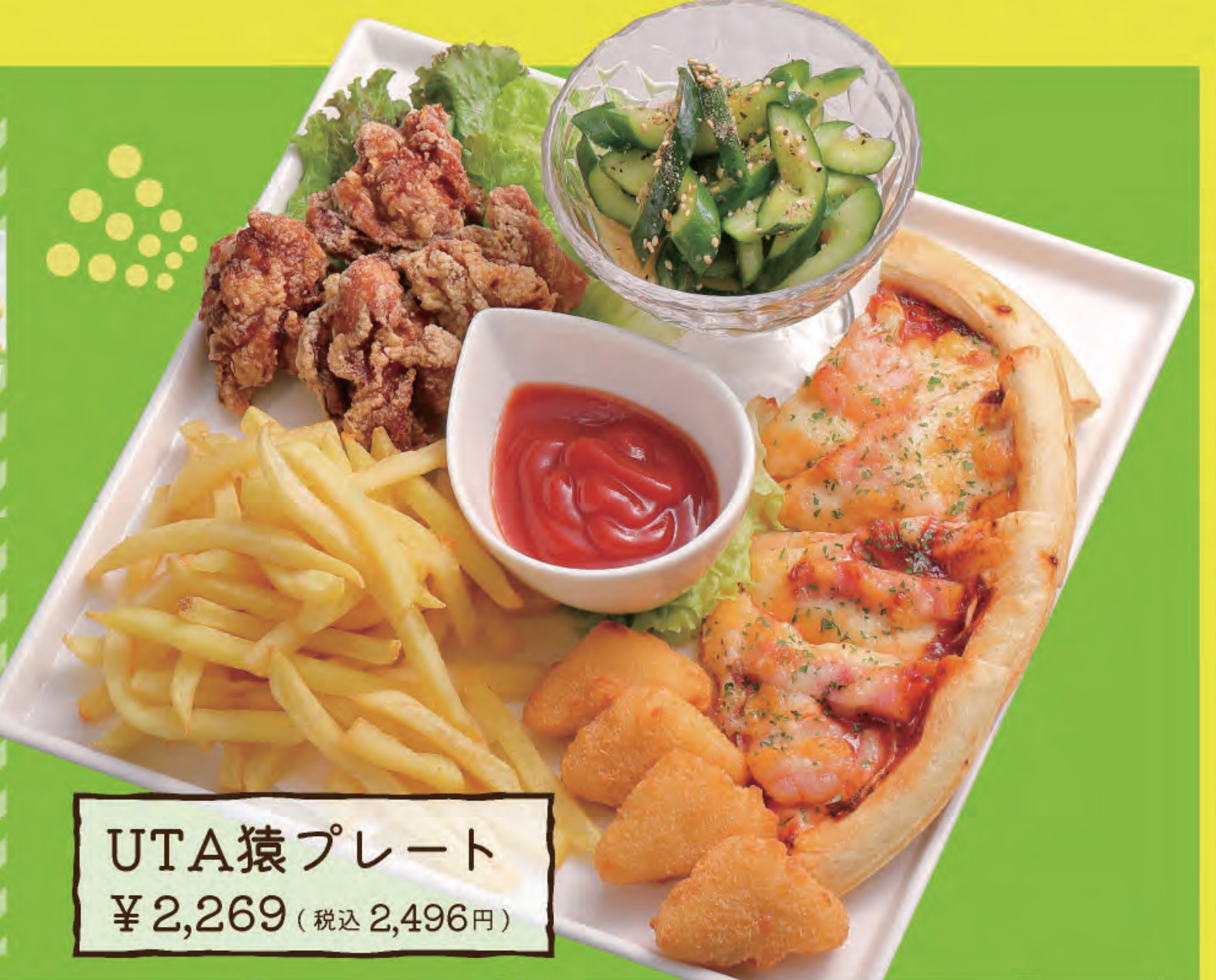
UTA猿プレート ¥2,269 (税込2,496円)