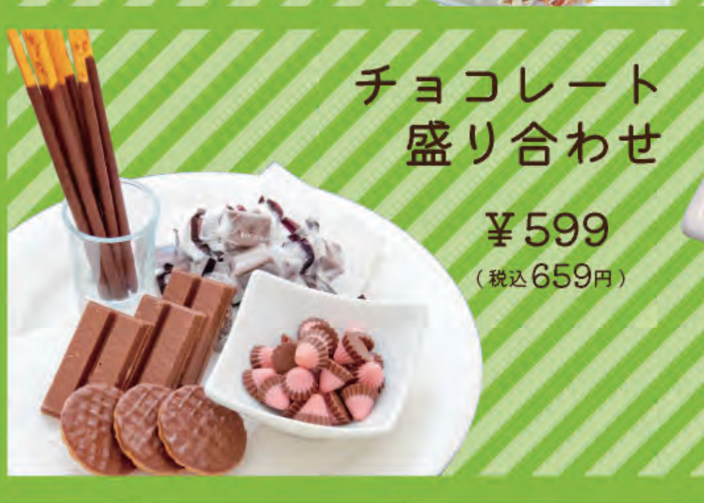
チョコレート盛り合わせ ¥599 (税込659円)