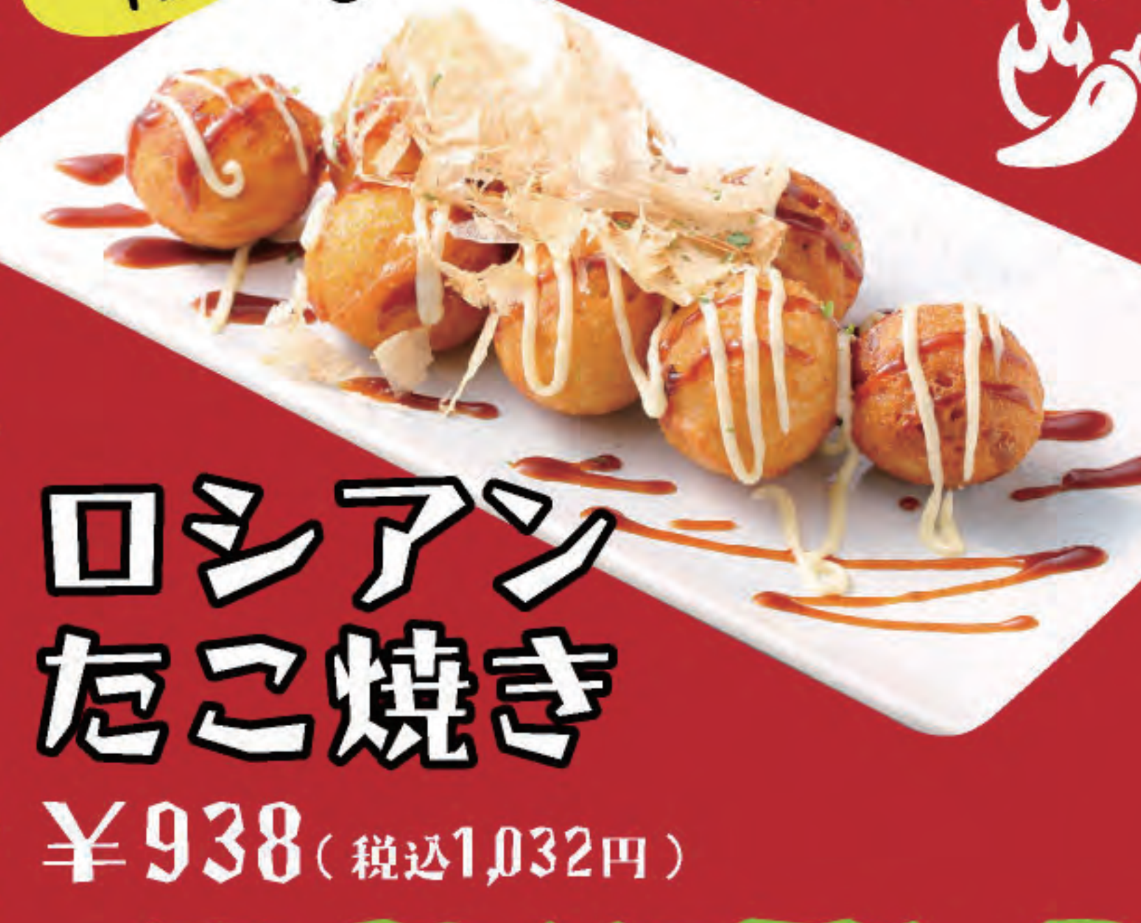
ロシアンたこ焼き ¥938 (税込1,032円)