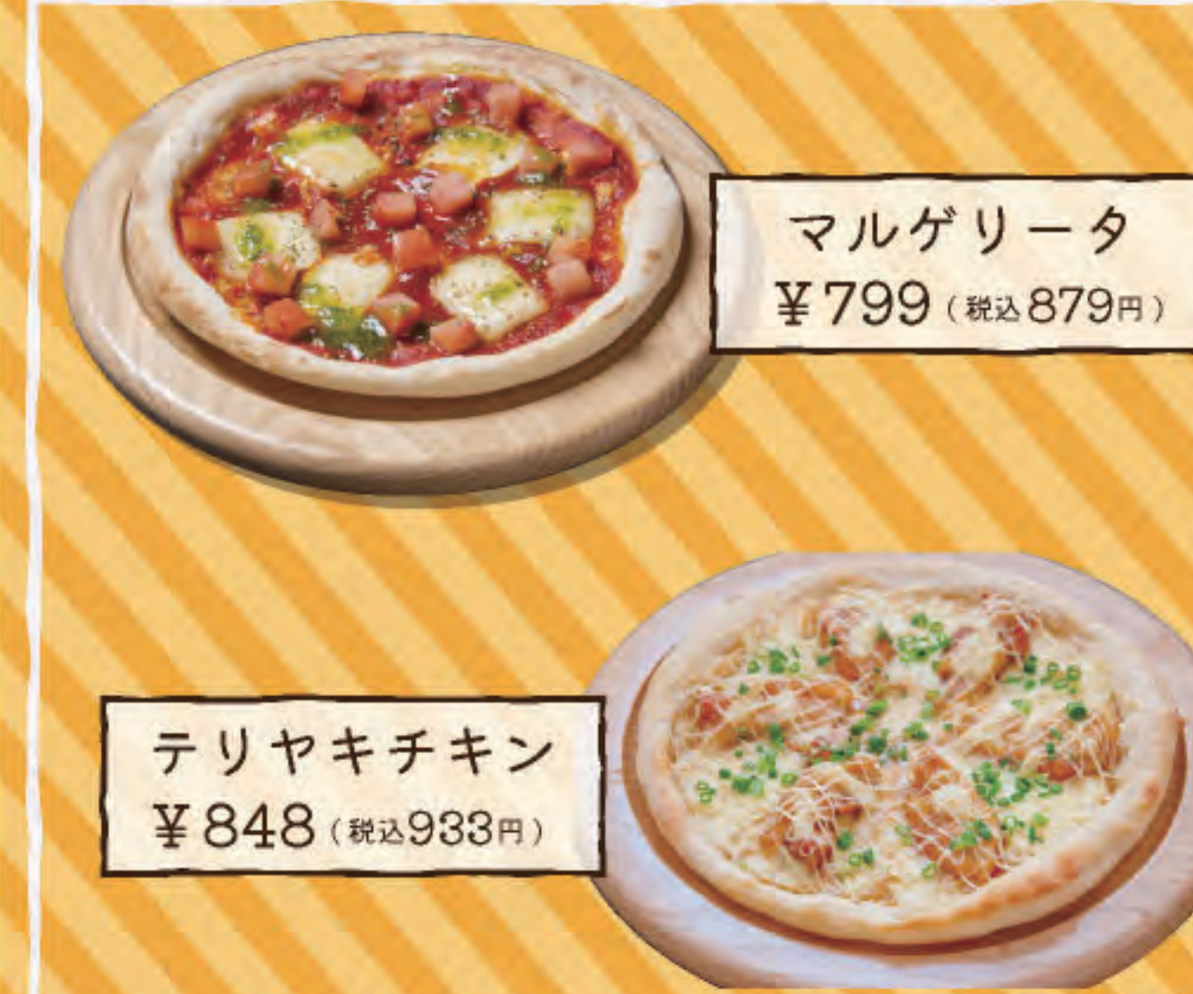
マルゲリータ ¥799 (税込879円)