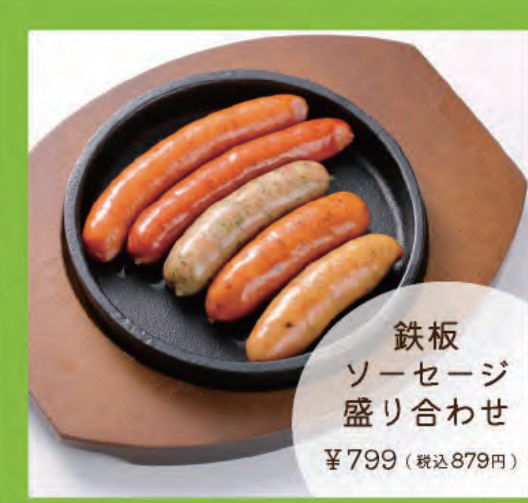
鉄板ソーセージ盛り合わせ ¥799 (税込879円)