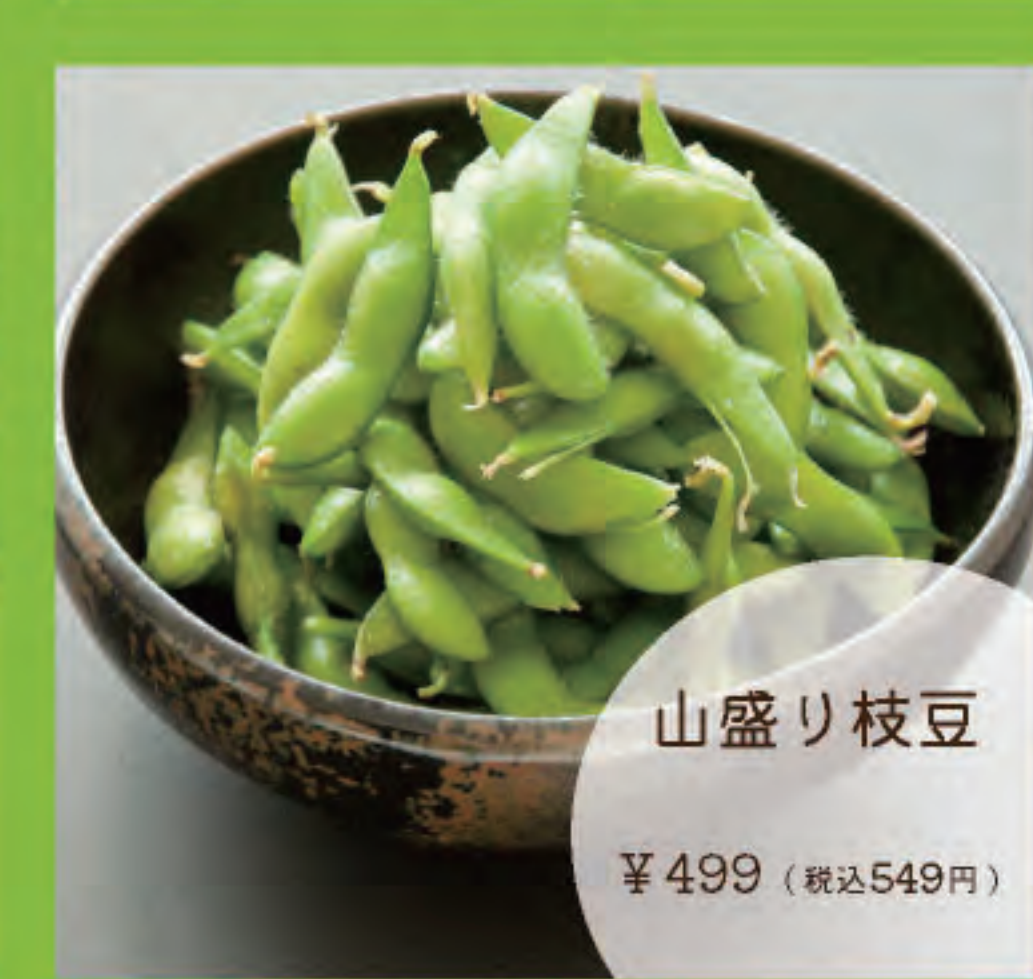
山盛り枝豆 ¥499 (税込549円)