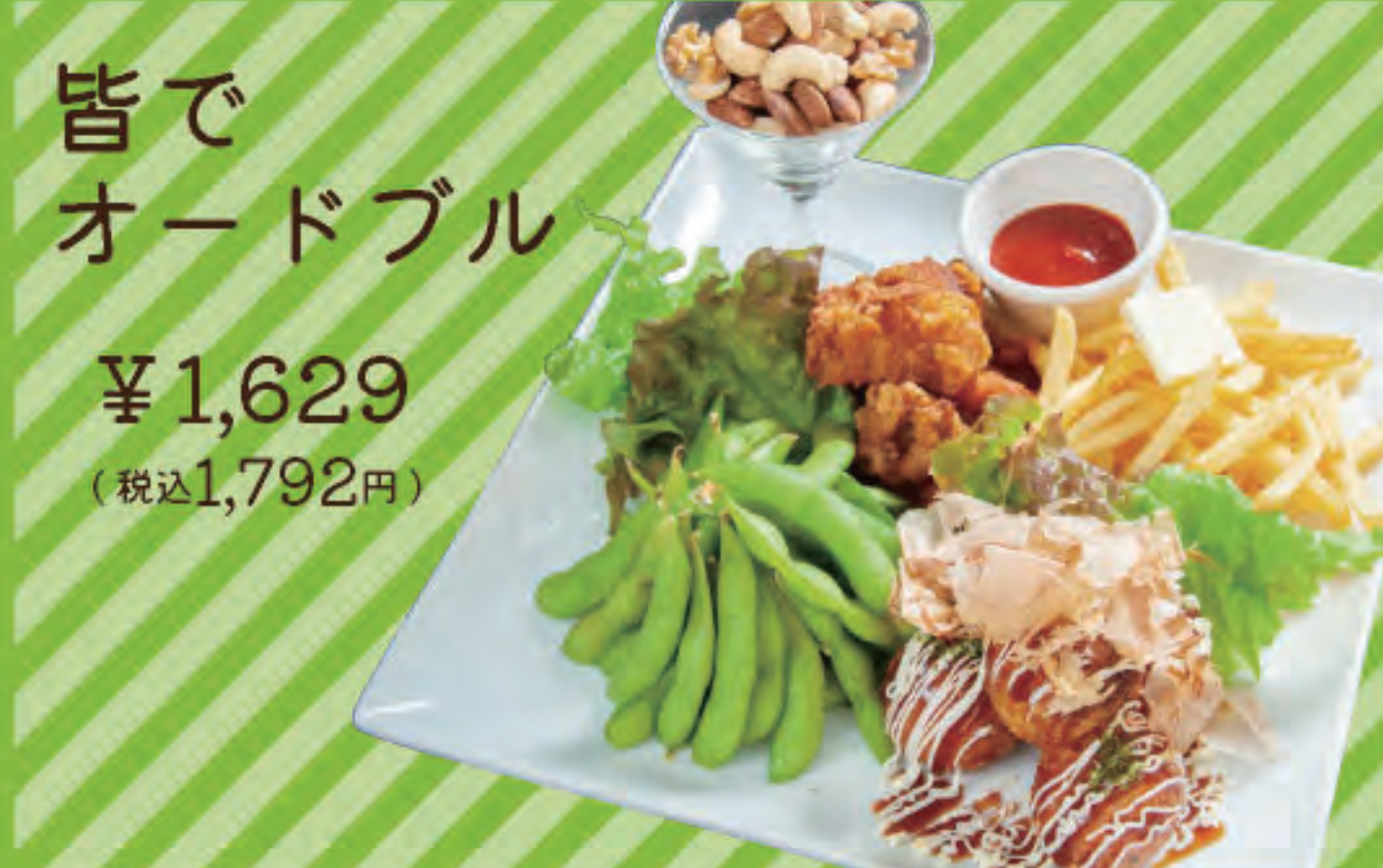
皆でオードブル ¥1,629 (税込1,792円)