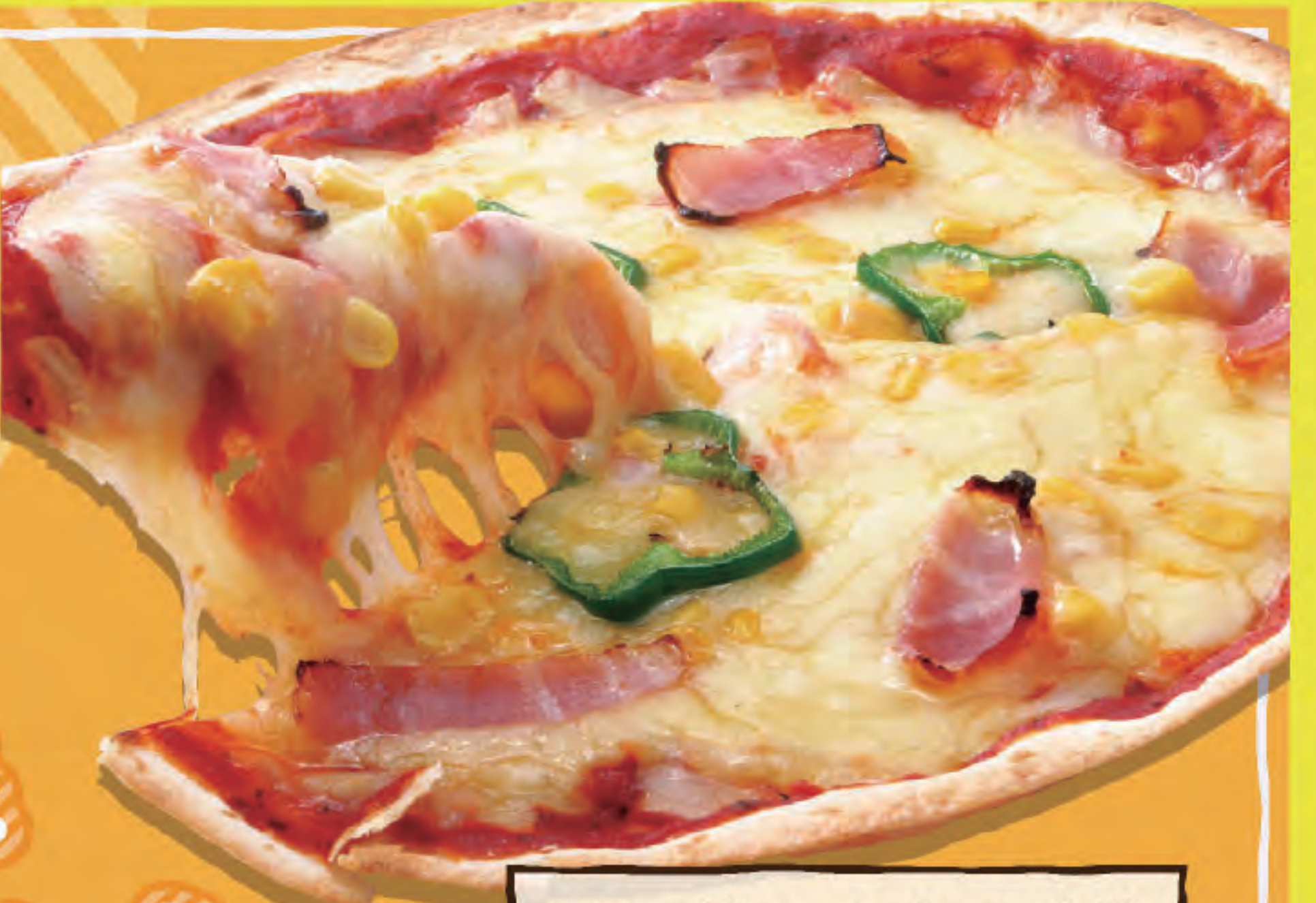
UTA猿ミックスピザ ¥809 (税込890円)