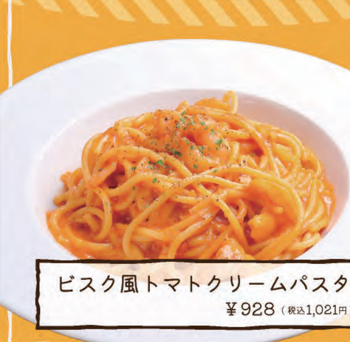
ビスク風トマトクリームパスタ ¥928 (税込1,021円)