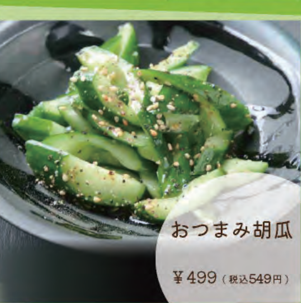
おつまみ胡瓜 ¥499 (税込549円)